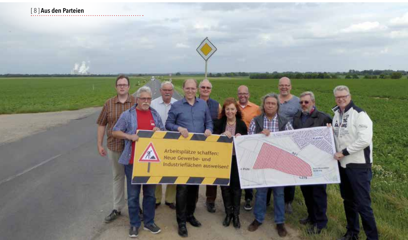
Die SPD-Fraktion fordert an der L279 Richtung Autobahnauffahrt ein neues Gewerbe- und Industriegebiet.