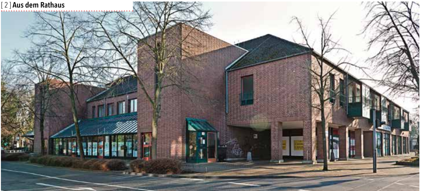
Die Immobilie des ehemaligen „Toom“-Marktes.