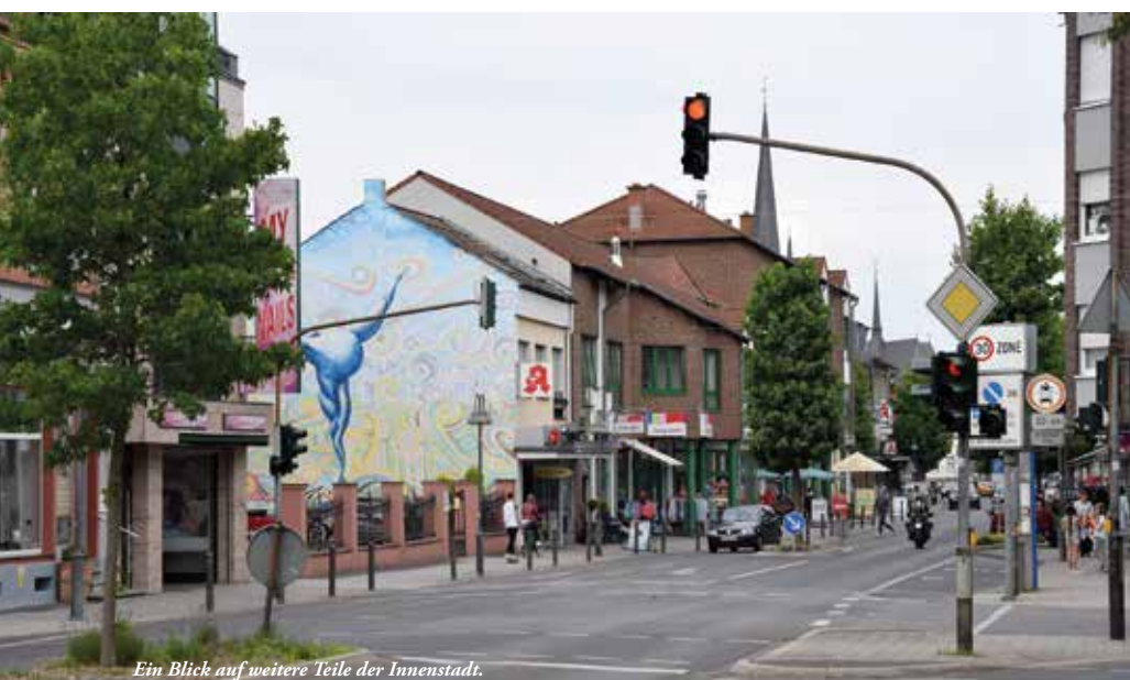
Ein Blick auf weitere Teile der Innenstadt.

Der von Bürgermeister Sascha Solbach vorgeschlagene Zeitplan sieht vor, dass nach Festlegung des Rahmens durch den Rat, das Bieterverfahren während der Sommerpause laufen soll, so dass bereits nach den Sommerferien die Vorschläge diskutiert werden können. Dazu sollen auch die Bürgerinnen und Bürger informiert und eingeladen werden, um sich eine Meinung zu bilden. Anschließend soll noch in diesem Jahr im Rat beschlossen werden, welcher Investor mit seinem Vorschlag die Bedburger Mitte gestalten soll. Und dann geht es los!