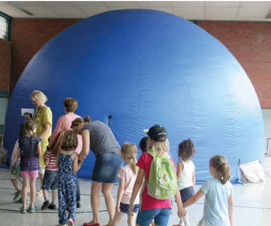
Der Besuch im Planetarium war für viele Kinder ein besonderes Highlight des Schulfestes.

Die Wilhelm-Busch-Schule Bedburg lud ihre Schülerinnen und Schüler gemeinsam mit deren Familien am 10. Juni 2017 zum jährlichen Schulfest ein. Zu bestaunen gab es viel, darunter ein Planetarium in der Turnhalle an der Oepenstraße, das den Kleinen faszinierende Sternbilder präsentierte.