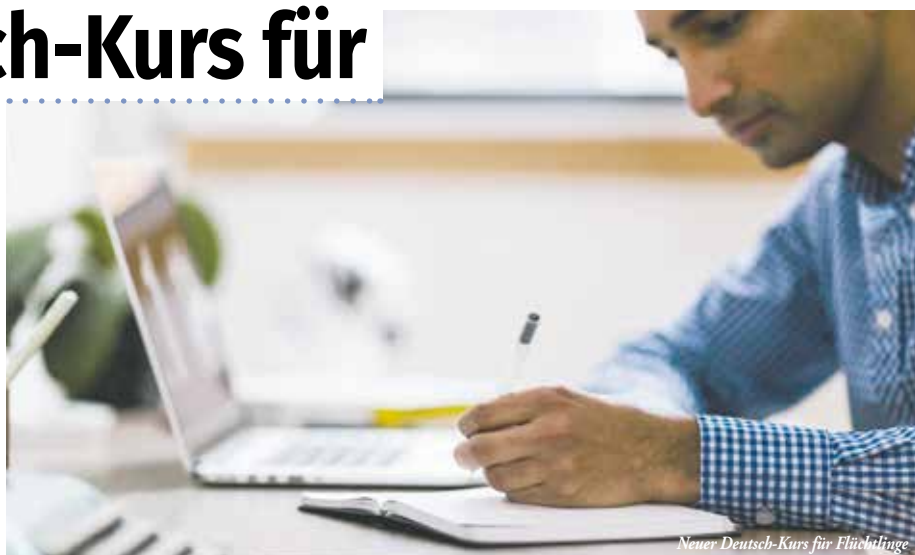
Neuer Deutsch-Kurs für Flüchtlinge

Voraussetzungen sind ein Mindestalter von 16 Jahren sowie eine lateinische Alphabetisierung. Die Teilnahme ist kostenlos,