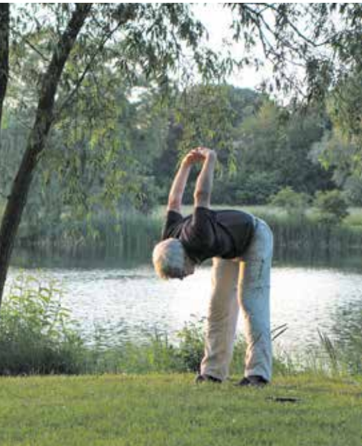
Das neue Bewegungsangebot verbindet die Bereiche Sport und Natur.

Ins Leben gerufen wurde das Angebot vom TV Bedburg 1927 e. V. und der evangelischen Kirchengemeinde Bedburg in Kooperation mit dem KreisSportBund Rhein-Erft e. V., der dieses im Rahmen des Programms „Bewegt ÄLTER werden in NRW!“ fördert.