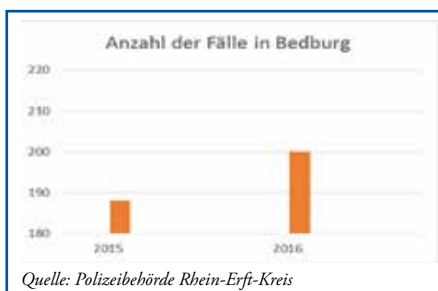
Ein Blick auf die Zahl der Fälle von Vandalismus, Sachbeschädigung oder Verschmutzung in Bedburg sowie NRW.

Trotz Überwachung durch das Ordnungsamt und der Bestätigung der Polizei, dass es keine überdurchschnittliche Zunahme der gemeldeten Vorfälle gibt, wird das Gefühl, dass wir es mit mehr Vandalismus zu tun haben, stärker. Woher kommt dieser Eindruck? Ein Aspekt ist, dass viele Straftaten bis vor wenigen Jahren, also der Zeit vor den so genannten „Sozialen Medien“, anders oder gar nicht dokumentiert wurden und eine glaubwürdige Statistik für diese Zeit nicht vorliegt. Die Verbreitung und die Wirkung der sozialen Medien und der generellen Berichterstattung haben in den vergangenen Jahren deutlich zugenommen. Vorfälle werden schneller öffentlich gemacht und verbreitet, wodurch ein subjektives Gefühl der Zunahme dieser entstehen kann.