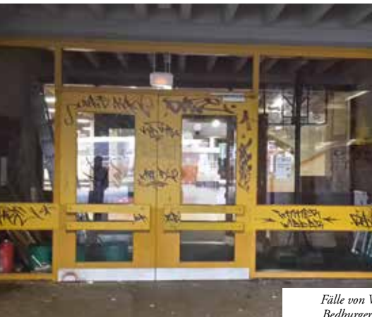
Fälle von Vandalismus am Bedburger Schulzentrum.