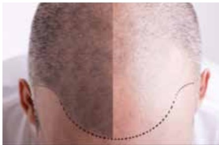
Pigmentierung der Kopfhaut bei lichtem Haar.

Modernste Geräte des gleichnamigen Anlagenherstellers Beautymania ermöglichen effektive