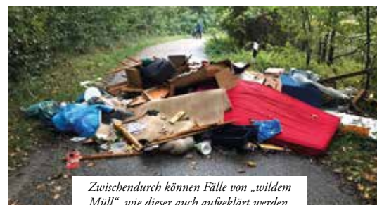
Zwischendurch können Fälle von „wildem Müll“ wie dieser auch aufgeklärt werden.

Dass ein Großteil der Vorfälle nicht aufgeklärt wird, ist jedoch nicht zu leugnen. „Es ist schwer, die Verursacher zu finden, da es häufig keine Hinweise auf sie gibt“, erklärt Claßen. Lediglich bei illegaler Abfallentsorgung ist es in Ausnahmen möglich, durch Heraussuchen persönlicher Gegenstände eine Täterin oder einen Täter zu finden. „Aktuell ist uns dies tatsächlich in einem Fall gelungen. Auf der Gürather Höhe wurde in der Nacht vom 29. zum 30. September 2017 wilder Müll aufgeschüttet. Wir haben durch persönliche Gegenstände den Eigentümer auffindig gemacht. Derzeit muss sich der mögliche Verursacher äußern und es wird anschließend von uns ein Bußgeld zwischen 500 und 1.000 Euro angesetzt“, so Claßen. Bei allen anderen Vergehen muss abgewogen werden, ob eine Anzeige bei der Polizei sinnvoll ist oder ob die Wahrscheinlichkeit, den oder die Täter zu fassen, zu gering ausfällt. „Oftmals kommen die Täter auch nicht aus Bedburg. Immer wieder berichten uns Bauern davon, dass Autofahrer von der Autobahn abfahren, nur um Müll auf ihren Feldern zu entsorgen und dann wieder flüchten“, erläutert Claßen. Auch wenn die Täter gefunden werden, zeigt sich oft, dass eine Entschädigung sehr gering ausfällt. Eines der häufigsten Delikte in Bedburg ist die