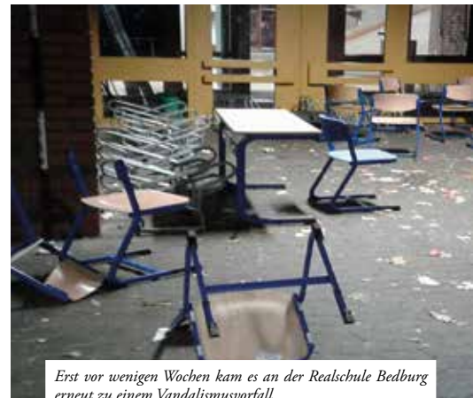
Erst vor wenigen Wochen kam es an der Realschule Bedburg erneut zu einem Vandalismusvorfall.