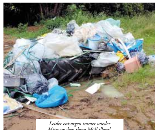
Leider entsorgen immer wieder Mitmenschen ihren Müll illegal.

Bitte denken Sie an die Umwelt und sorgen Sie dafür, dass das Stadtgebiet Bedburg sauber bleibt. Nutzen Sie das städtische Angebot. Wenn Sie sich nicht sicher sind, wie Sie Ihren Müll fachgerecht entsorgen können, gibt es auf der Internetseite der Stadt Bedburg viele hilfreiche Hinweise ( www.bedburg.de ).