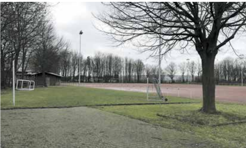
Die SPD unterstützt den Umbau des Aschenplatzes in einen Kunstrasenplatz.