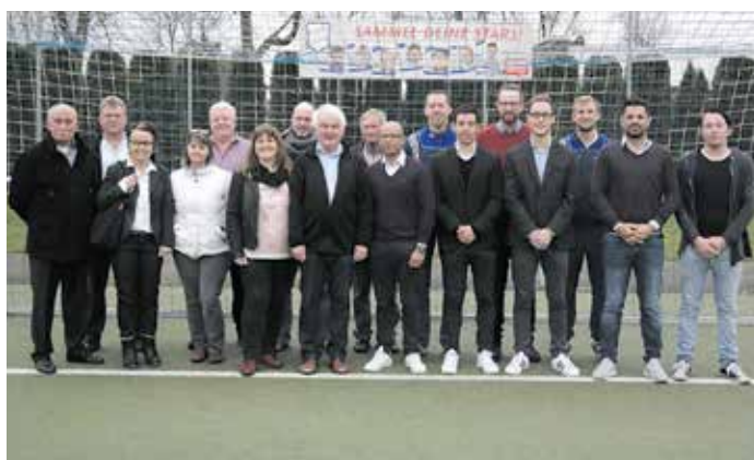
Der neue und der alte Vorstand des SC Borussia