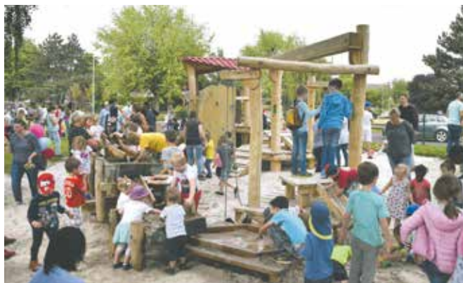
Besonders der Wasser-, Sand- und Matschspielbereich begeisterte viele Kinder.

Anfang September 2017 beriet eine Spielplatzkommission über die eingereichten Angebote und legte dabei ein besonderes Augenmerk auf die Bewertung des Spielwertes. Den Zuschlag erhielt der Spielgerätehersteller Kindt, der Anfang 2018 mit den Boden- und Aufbauarbeiten begann. Das Projekt erhielt Zuwendungen des Landesprogramms „Zuweisungen für Investitionen an Gemeinden zur Förderung von Quartieren mit besonderem Entwicklungsbedarf“ in Höhe von 96.000 Euro.