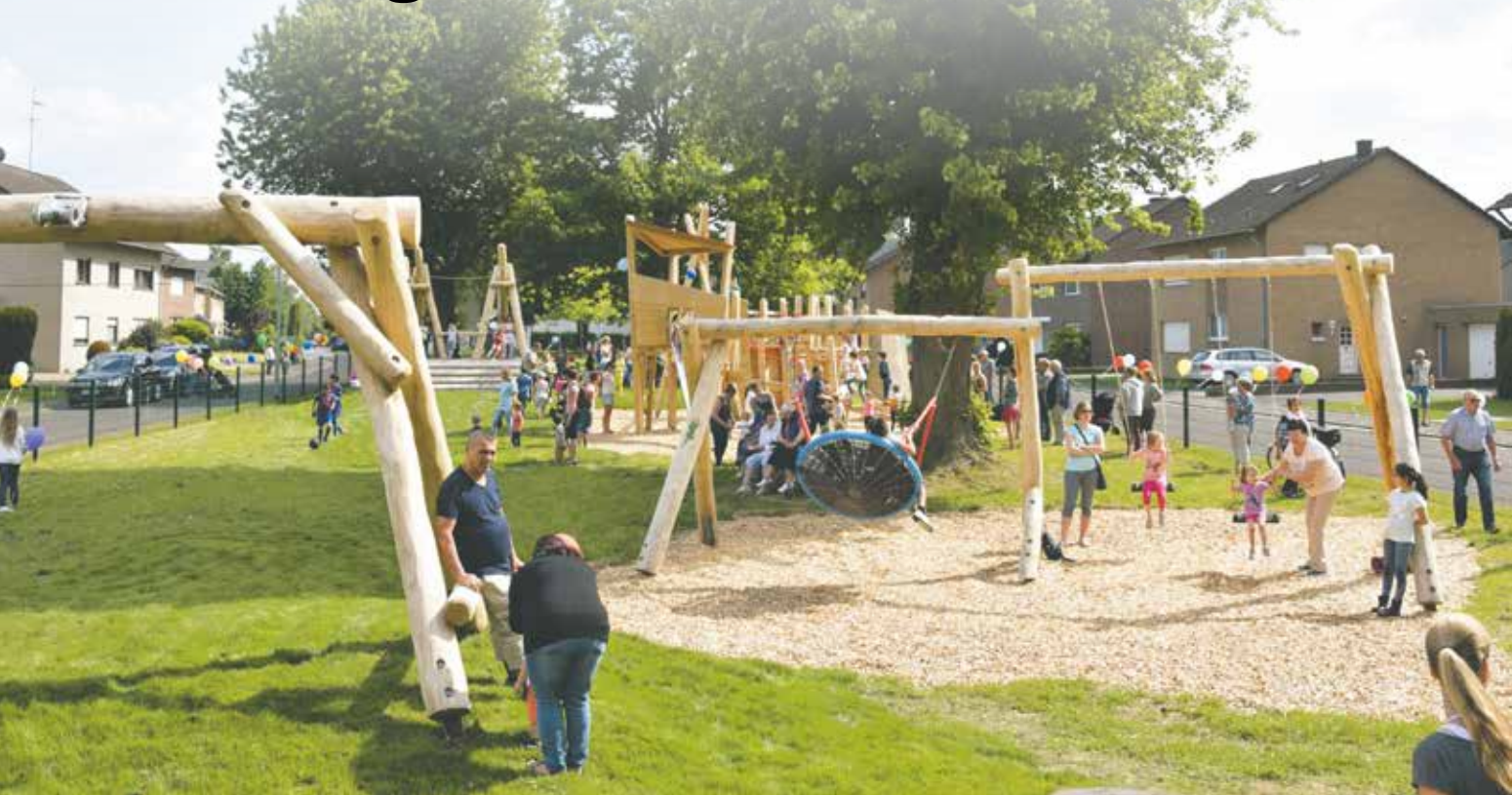
Dieser Spielplatz lässt Kinderherzen höher schlagen: Ob Klettern, Schaukeln, Rutschen oder eine andere Aktivität, hier ist für jedes Kind das passende Spielgerät dabei.

Im Herzen von Bedburg-West und Blerichen ist ein toller Ort zum Spielen und Austauschen entstanden. Darin waren sich die vielen großen und kleinen Bürgerinnen und Bürger am Nachmittag des 15. Mai 2018 einig. Sie alle waren zur offiziellen Eröffnung des neuen Spielplatzes „Bedburger Schweiz“ zwischen der Bedburger Schweiz und der Oberschlager Straße gekommen.