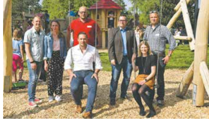
Die Verantwortlichen der Stadt Bedburg suchen mit Spielplatznutzern und Anwohnern den Dialog

Vorrangig möchte die Stadt jedoch für gegenseitiges Verständnis werben und bittet sowohl alle Anwohnerinnen und Anwohner als auch alle Nutzerinnen und Nutzer des Spielplatzes, die gegenseitigen