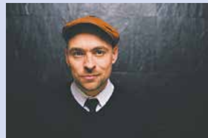
Max Mutzke

Weitere Informationen werden regelmäßig unter www.musikmeile-bedburg.com veröffentlicht: