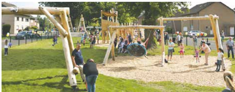
Der neue Spielplatz ist der Sommerhit in Bedburg

- Alle Autofahrer werden dringend darum gebeten, sich unbedingt an die Geschwindigkeitsbegrenzung von 30 km/h zu halten, damit es zu keinen schlimmen Unfällen kommt!