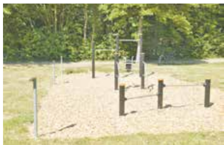
An den Geräten können Kraft, Koordination und Ausdauer trainiert werden.

Über weitere Details zur „Anti-Haufen“-Kampagne sowie den Start dieser informiert die Stadt Bedburg rechtzeitig im Voraus.