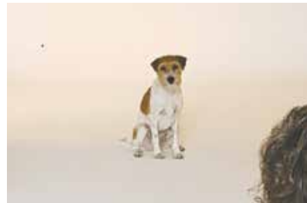
Whippet Emil, Golden Retriever Marla und Kromföhländer Calle gaben – so wie die anderen tierischen Models – ihr Bestes vor der Kamera.

Der Aufruf und die Kampagnenidee stießen auf breites Interesse. Chihuahua, Beagle, Langhaarcollie und Co., knapp 70 Bewerbungen gingen bis zum 01. Juli 2018 bei der Stadtverwaltung ein – unter ihnen auch zahlreiche Mischlingshunde. Ganz klar, dass der Düsseldorfer Werbeagentur SIXPACK – zuständig für die Entwicklung der Kampagne – die Auswahl da nicht leicht fiel und doch machten schließlich neun tierische Models das Rennen. Sie decken aufgrund ihrer optischen Unterschiede eine große Bandbreite an Hunderassen ab – ideal, um möglichst viele Bedburger Hundehalterinnen und -halter durch die Aktion zu erreichen.