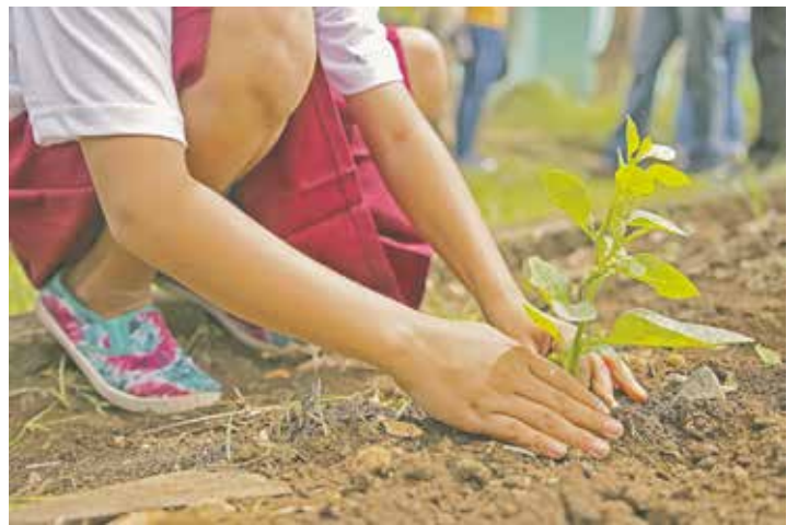
Viele Arbeiten fallen im Alter schwerer, eine helfende Hand ist dann Gold wert.

Die Bedburger Taschengeldbörse bringt Jobanbieter und Taschengeldverdiener kostenfrei und unbürokratisch zusammen: Jugendliche zwischen 14 und 20 Jahren, die gerne für andere kleinere Arbeiten übernehmen möchten, und ältere oder mobilitätseingeschränkte Menschen, die entsprechende Unterstützung suchen, können darüber miteinander in Kontakt treten. Ab dem 03. September 2018 können die ersten Angebote bzw. Gesuche über die Plattform „dasnez“ online geschaltet werden.