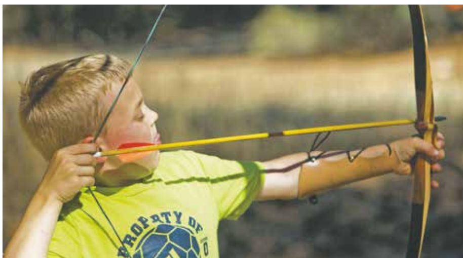
Auch das Bogenschießen können die Kinder während der Erlebnistage ausprobieren.

Weitere Informationen folgen nach den Sommerferien und können ab dem 03. September 2018 beim Stadtjugendpfleger Benjamin Küppers (Friedrich-Wilhelm-Straße 43, 50181 Bedburg; b.kueppers@bedburg.de, 02272 - 402 578) erfragt werden.