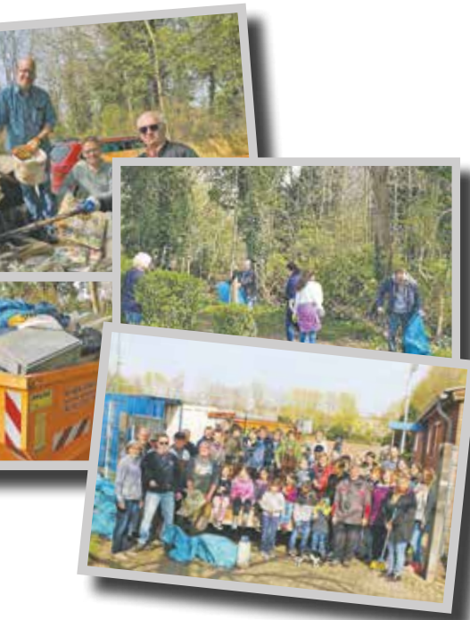
Impressionen der Müllsammelaktion.