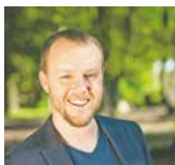
Daniel Freund.

Als bevölkerungsreichstes Land in der EU wird Deutschland im Europäischen Parlament von 96 Abgeordneten vertreten. Knapp 61 Millionen Deutsche können am 26. Mai mit ihrer Stimme über die Verteilung der Sitze entscheiden. Ihnen zur Wahl stehen 41 Parteien und Vereinigungen, denen auch Kandidatinnen und Kandidaten angehören, die sich bisher noch nicht auf der europäischen Politikbühne bewegt haben.