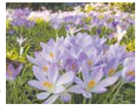
Krokusse werden von Bienen und Hummeln nach einem langen Winter gerne als Futterquelle angenommen.

Aufgrund der zahlreichen Bautätigkeiten in der Stadt werden in naher Zukunft viele neue öffentliche Grünflächen gestaltet werden. Nach den Vorstellungen der SPD sollen diese insektenfreundlich angelegt werden.