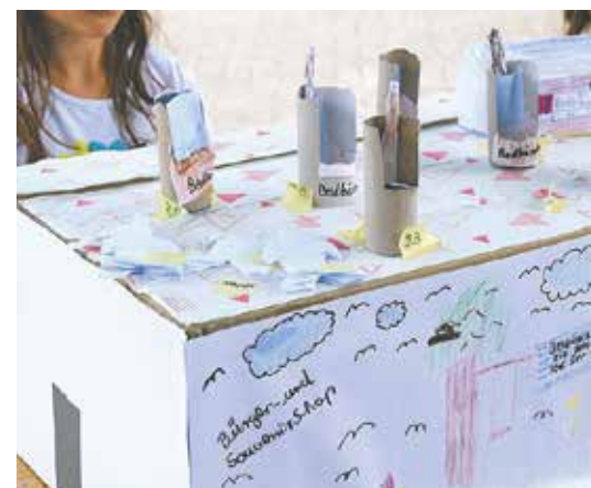
Im Postamt verkauften die Kinder selbstgebastelte Postkarten, Stadtpläne und Souvenirs.