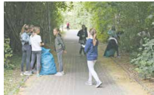
Rund um das Schulgelände bis hinunter zur „Netto“-Filiale suchten die Schülerinnen und Schüler an Straßenrändern und Gebüsch nach Müll.

Im Juli stürzten sich die Schülerinnen und Schüler bei einer großen Müllsammelaktion dann mit Greifzangen ausgerüstet in die Arbeit. Neben Verpackungsmüll machten die Kinder dabei auch ungewöhnliche Funde, darunter Computer- und Waschmaschinenteile, Überreste eines Fernsehers und benutzte Windeln. Am Ende kam ein stattlicher Berg gefüllter Müllsäcke zusammen. Die Mädchen und Jungen können stolz auf sich sein. Weitere Aktionen zum Thema werden am Silverberg-Gymnasium folgen.