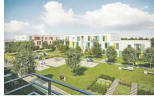
Der Blick auf die Wohnanlage. © HOME.architekten

Am 4. Juli beschloss auch der Rat der Stadt Bedburg den Verkauf. Bürgermeister Solbach und Erft-