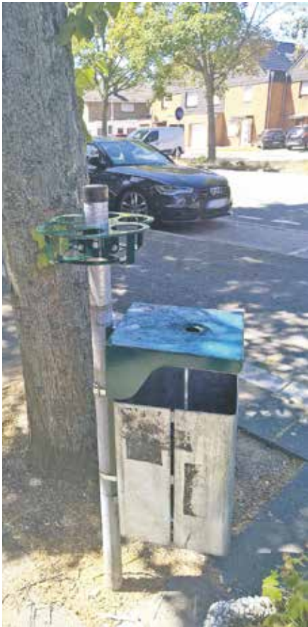
Der Pfandring am Standort in Kaster.

Den Anstoß gab die SPD-Fraktion im Rat der Stadt Bedburg mit einem Antrag zu Beginn des Jahres, der darauf aufmerksam machte, dass in Bedburg immer häufiger Flaschen u. a. in Müll-