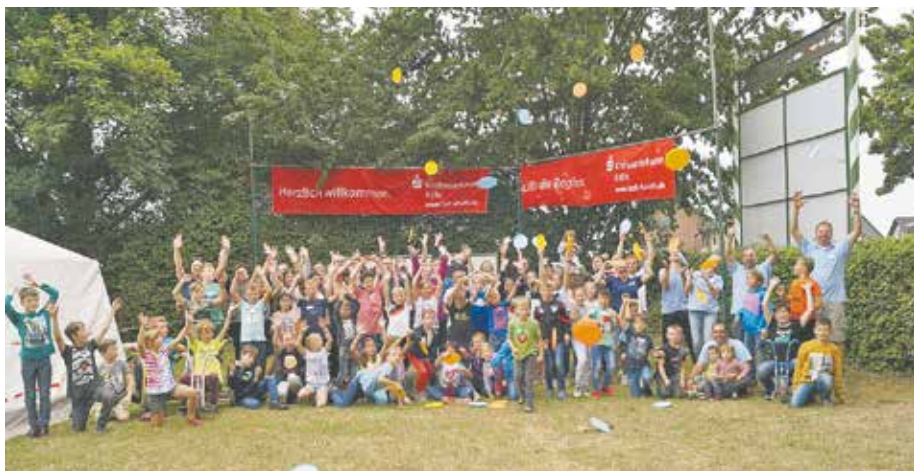
Die Freude über das neue Geschirr war bei allen riesig groß.

Bis zu 60 7- bis 14-jährige Kinder erlebten vom 12. bis 14. Juli beim traditionellen Feriencamp der Interessengemeinschaft Königshovener Vereine ein Abenteuer voller Spiel und Spaß. Or-