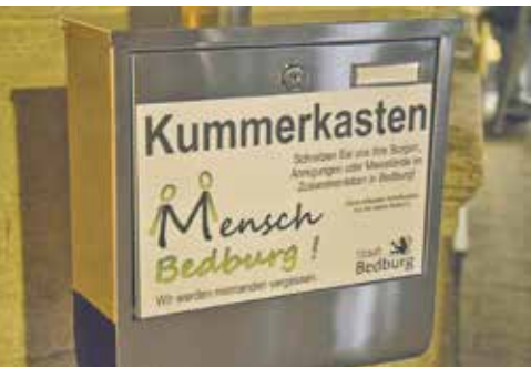
Eingeweiht wurde der Kummerkasten im Rahmen des Aktionstages „Mensch Bedburg!“ am 9. November 2018 auf dem Bedburger Marktplatz.

Der „Mensch Bedburg!“-Kummerkasten befindet sich auf der Reise durch das Stadtgebiet. Vom 9. August bis voraussichtlich 5. September 2019 macht er Station in Lipp (auf Höhe der Alten Schule, Erkelenzer Str. 78) .