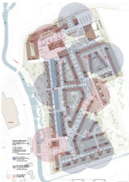
Der Plan für das Unterflursammelsystem von kister scheithauer gross architekten und stadtplaner