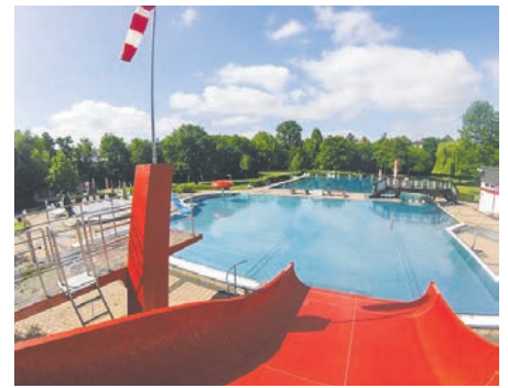
Das Bedburger Freibad.

Wir bedanken uns bei den zahlreichen Freibadgästen und freuen uns auf ein Wiedersehen in 2020.