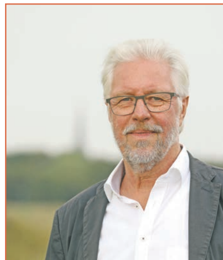
Jochen vom Berg Fraktionsvorsitzender Bündnis 90 | Die Grünen