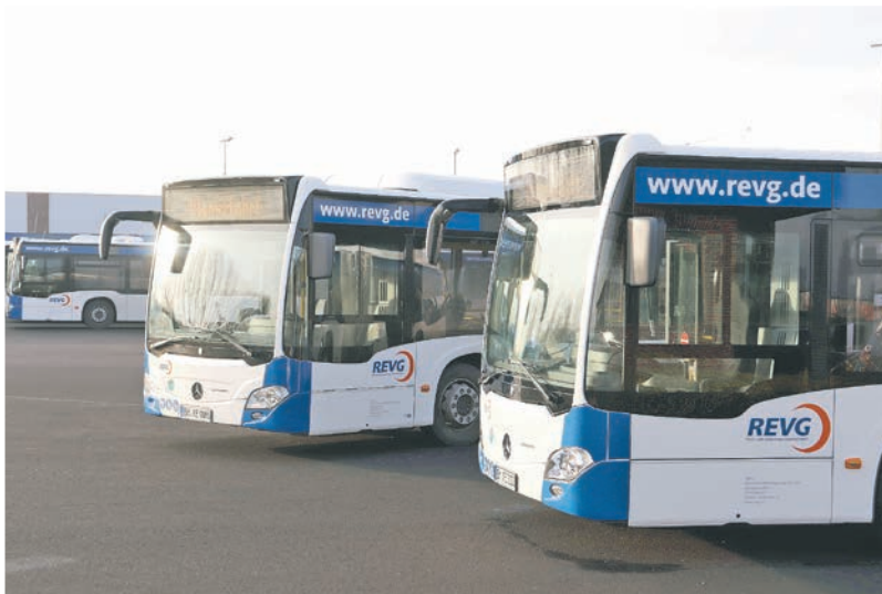
Die Stadt Bedburg bietet in Kooperation mit der REVG erstmals Zusatzfahrten zum Festival an.

Sie wollen das musikalische Highlight 2019 nicht verpassen? Dann kommen Sie doch ganz entspannt mit dem Bus zur MusikMeile und danach auch wieder sicher nach Hause – in diesem Jahr ist das erstmals möglich. Die Stadt Bedburg und die REVG Rhein-Erft-Verkehrsgesellschaft haben sich für die Besucherinnen und Besucher des Festivals für diesen Service zusammengetan. Insgesamt drei Buslinien und ein Shuttlebus-Transfer verbinden durch Zusatzfahrten sowohl entferntere Ortsteile wie Rath als auch Nachbarorte wie Elsdorf mit dem Festivalgelände.