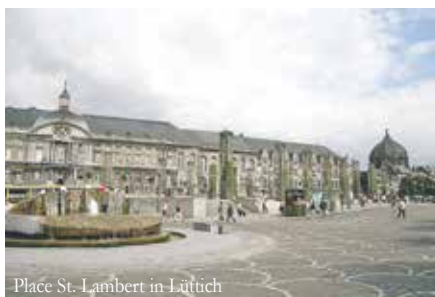
Place St. Lambert in Lüttich