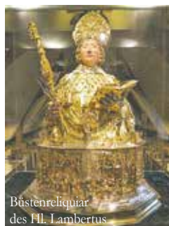
Büstenreliquiar des Hl. Lambertus