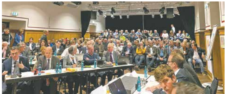
Viele Bürgerinnen und Bürger waren zur Ratssitzung ins Schloss Bedburg gekommen.

Quartier. Das höchste Gebäude wird kein reines Wohnhaus sein. Es wird eine Mischnutzung aus Gastronomie, Gewerbe und Wohnen geben – durch diese Konzeption soll das Quartier einen lebendigen Fixpunkt erhalten.