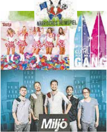
© Bedburger Narrenzunft / SC Borussia Kaster-Königshoven