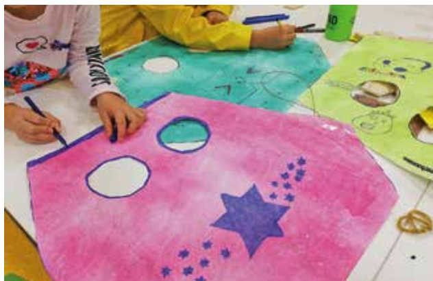
Beim Basteln der Flugdrachen erfuhren die Kinder viel Wissenswertes über die Geschichte dieser und die Faszination des Fliegens.

Ein buntes und herbstliches Programm erwartete 40 Mädchen und Jungen bei den Herbstferienspielen der Stadt Bedburg vom 14. bis 18. Oktober – vorbereitet von der städtischen Schulsozialarbeit sowie Erlebnispädagoginnen und -pädagogen der XPAD GmbH.