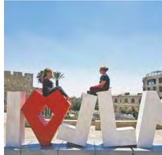
Ein beliebtes Fotomotiv: Das „I love Jerusalem“-Zeichen.

JS: Ich fand die lockere und spontane Einstellung der Menschen super. Gerade wenn etwas nicht so läuft wie geplant, sagen sie sich oft „Kein Problem, läuft es halt eben anders“. Sie sind nicht so verknüpft wie wir Deutschen. Sehr gewöhnungsbedürftig fand ich anfangs beson-