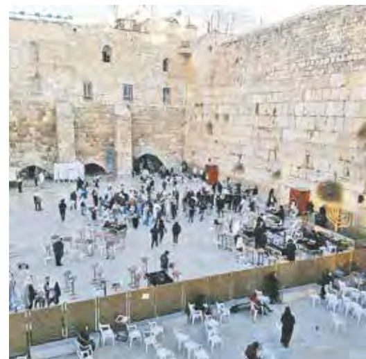
Die Klagemauer in der Altstadt von Jerusalem.

JS: Besonders der Kontakt mit den Menschen hat mir sehr gefallen. Wenn Touristen Fragen hatten, wie man wo am besten hinkommt oder ob ich einen Geheimtipp hätte, habe ich gerne weitergeholfen. Schnell kannten wir auch die Tourguides und haben mit ihnen immer Spaß gemacht, wenn sie kamen. Und wenn ich einmal