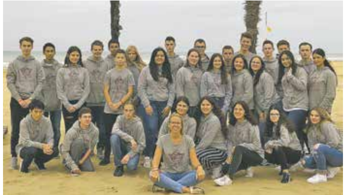
Realschule – 10a: Die Abschlussklasse 10a der Realschule Bedburg.