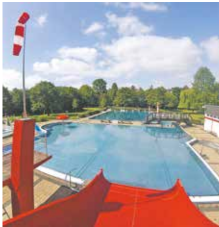
Das Bedburger Freibad.

Um auch Menschen einen Besuch im Freibad zu ermöglichen, die über kein Smartphone / Tablet zum Vorzeigen des Online-Tickets bzw. keinen Drucker zum Ausdrucken des print@home-Tickets verfügen und die hierbei von Freunden