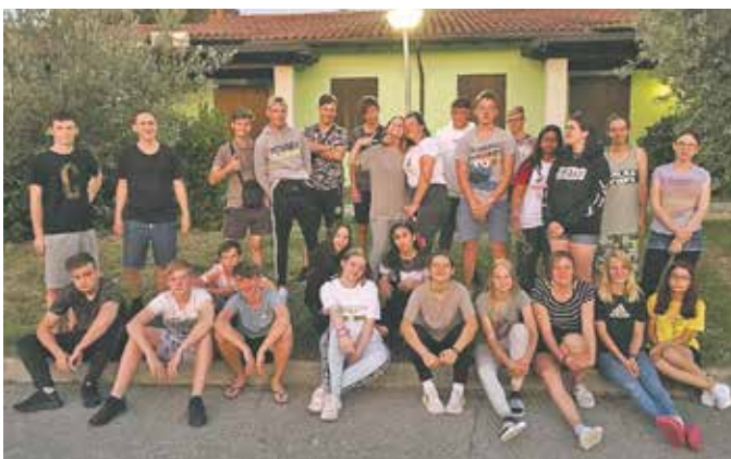
Realschule – 10b: Die Abschlussklasse 10b der Realschule Bedburg.