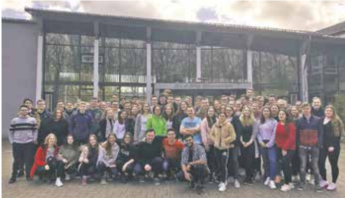
Gymnasium: Der Abschlussjahrgang des Silverberg-Gymnasiums.

Anm. d. Red.: Die hier abgebildeten Fotoaufnahmen haben uns die Schulen zur Verfügung gestellt, sie entstanden vor dem Beginn der Corona-Pandemie; leider gab es aus dieser Zeit keine Aufnahme vom Abschlussjahrgang der Arnold-von-Harff-Schule. Wir bitten dies zu entschuldigen.