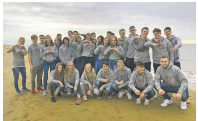
Realschule – 10c: Die Abschlussklasse 10c der Realschule Bedburg.