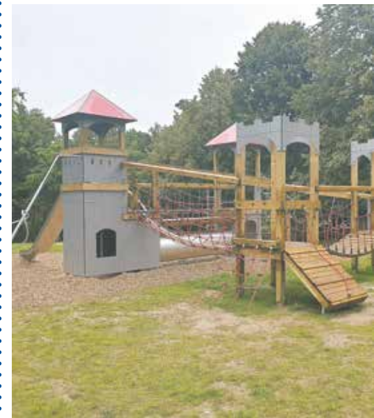
Die große Ritterburg auf der Spielfläche Alt-Kaster.

Seit wenigen Wochen ist es so weit: Unsere große Ritterburg auf dem Spielplatz in Alt-Kaster wurde zum Spielen freigegeben. Aus diesem besonderen Anlass laden Bürgermeister Solbach und Klaus Brunken, Fachdienstleiter des Jugendamtes der Stadt Bedburg, alle Bürgerinnen und Bürger herzlich zur Eröffnungsfeier am 14. August um 15:00 Uhr auf die Spielfläche ein. Wir freuen uns auf zahlreiches Erscheinen!