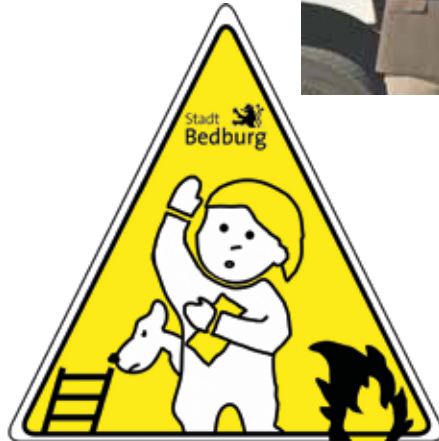
Der reflektierende Aufkleber dient in Zukunft dazu, Kinder im Brandfall schneller zu finden.

Die Einsatzkräfte der Feuerwehr müssen ein Kinderzimmer sofort lokalisieren können, um die Suche nach den Kleinen schnellstmöglich zu