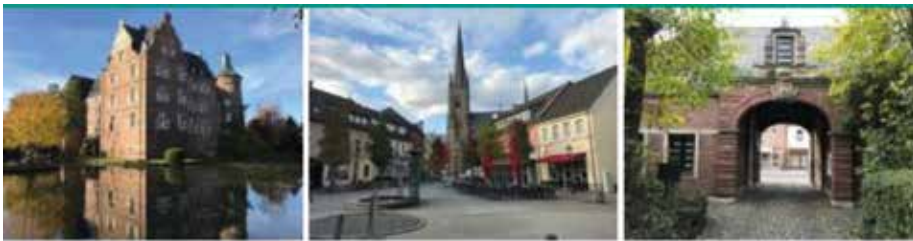
Städtebauförderung für Bedburg

Bedburg erhält Millionen Euro an Fördermitteln zur Neugestaltung der Innenstadt. Bedburg weist neue und innovative Baugebiete aus. Bedburg erhält im neuen Regionalplan neue Flächen für Gewerbeansiedlungen. In Bedburg findet in großem Umfang endlich wieder geförderter Wohnungsbau statt. In Bedburg werden neue Kindergärten und Schulen gebaut.