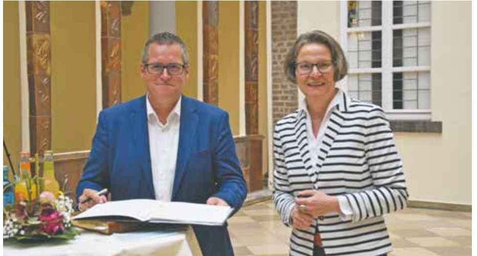
Bürgermeister Sascha Solbach und Ministerin Ina Scharrenbach

Ministerin Ina Scharrenbach: „Ich gratuliere Ihnen ganz herzlich zu dieser Maßnahme. Die ISEK-Förderung liegt uns als Landesregierung ganz besonders am Herzen. Aus diesem Grund übernehmen wir von Bund und Land in diesem Ausnahmejahr 2020 zusätzlich den kommunalen