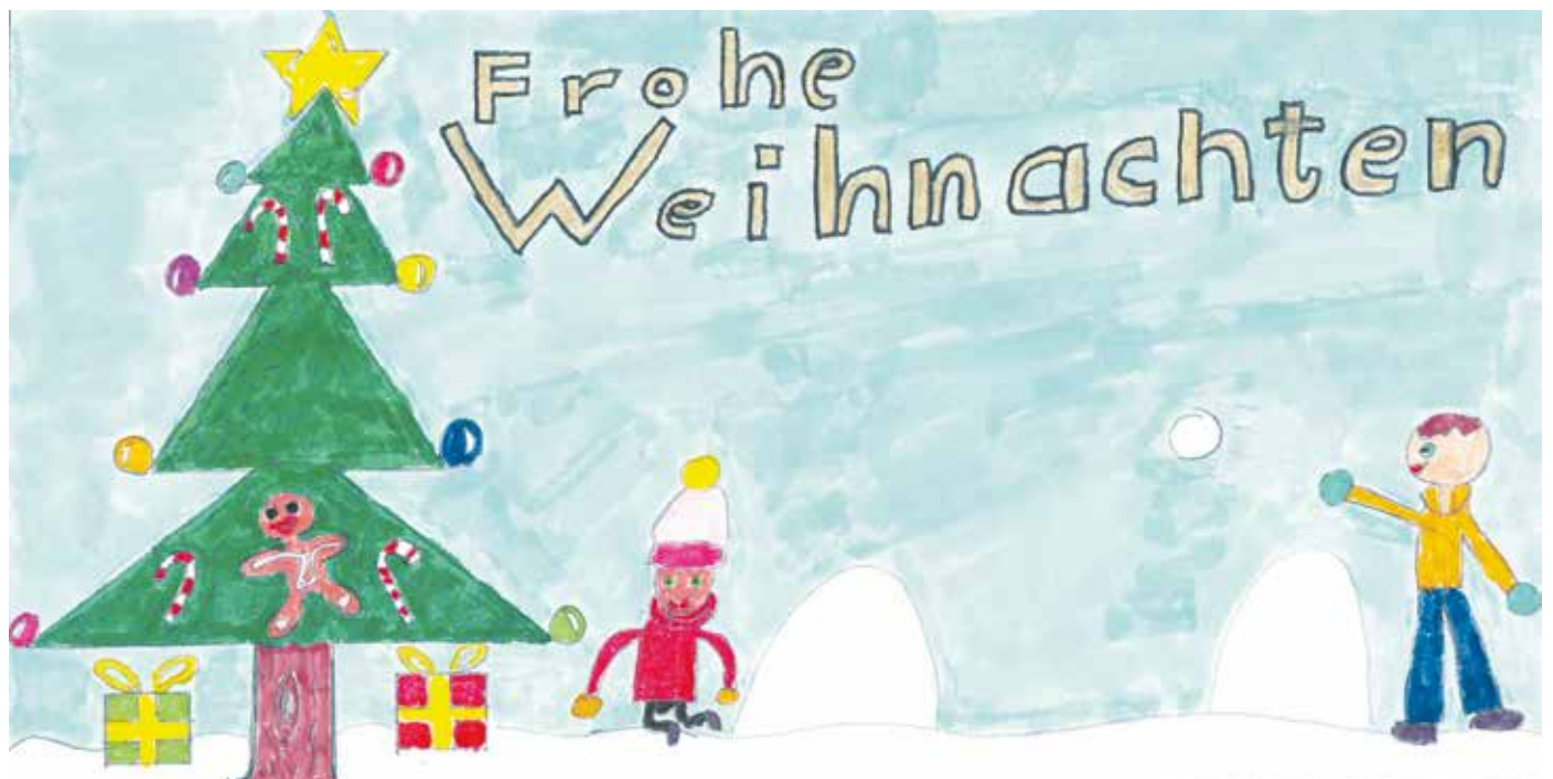
Ein Weihnachtsgruß an alle BedburgerInnen von Phoenix Koppetsch aus der Klasse 4b der Martinusschule Kaster.