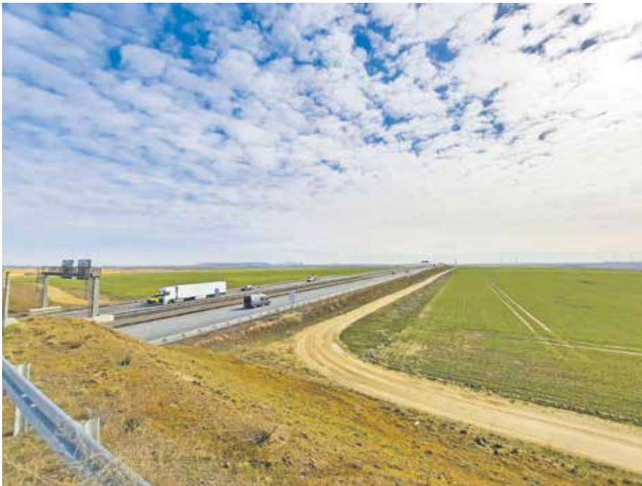
Alternativfläche A44n

Bedburgs und Jüchen angesehen, an deren Siedlungsanschluss es allerdings zur Zeit fehlt. Die CDU-Fraktion wird sich intensiv auf den verschiedenen politischen Ebenen dafür einsetzen,