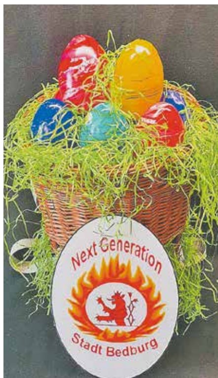
Ein Osternest als Überraschung für die Mitglieder der Jugendfeuerwehr.