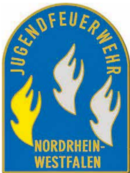
Das Abzeichen für die erste Stufe der Jugendflamme.

Damit die Abnahme der Jugendflamme 1, dem ersten Ausbildungsnachweis für jedes Jugendfeuerwehrmitglied, nach 2020 nicht erneut coronabedingt ausfallen würde, probierten Jugendwart*innen und Betreuer*innen dieses Jahr ein alternatives Konzept aus – mit Erfolg.