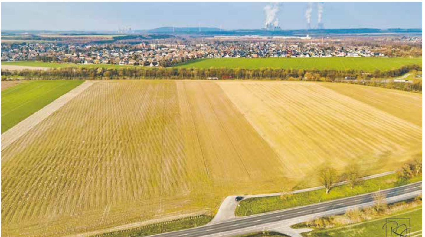
Luftaufnahme GIG Kaster