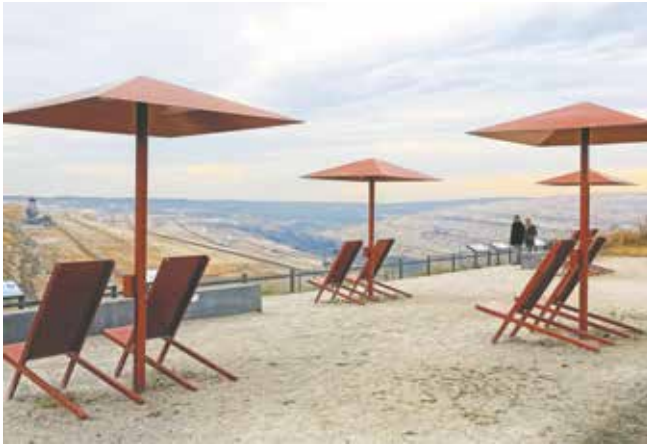
Am Ende des Speedways wartet ein herrlicher Ausblick über den Tagebau Hambach.

Der Rhein-Erft-Kreis und die Städte Bedburg, Bergheim und Elsdorf bitten damit nochmals um