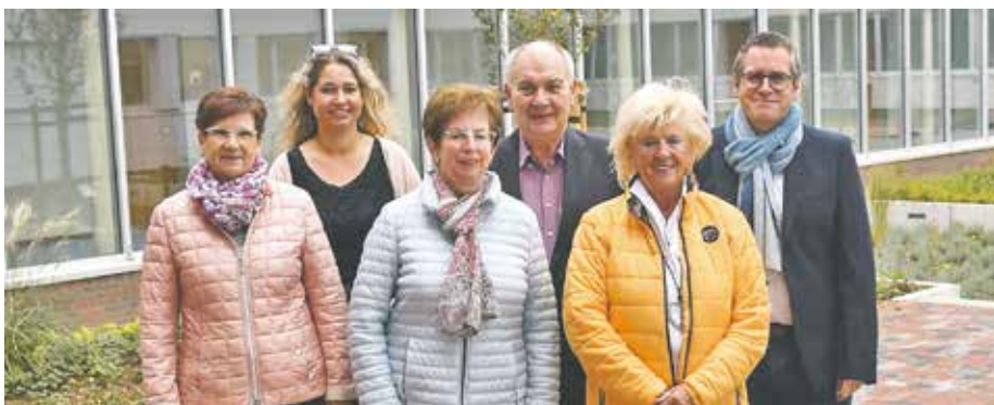
Vertreter*innen von Carisma, der Tafel und Frauen helfen Frauen e. V. freuen sich über die vom Stadtrat gesammelten Spenden.

Die Fraktionen schlugen Organisationen vor und das eingenommene Geld wurde gespendet. Insgesamt kamen 862 € zusammen, die durch Bürgermeister Solbach auf 1.000 € aufgestockt wurden. Der Betrag wurde jeweils zu einem Drittel an die Initiativen gespendet.