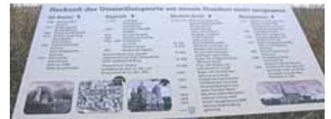
Die Infotafel auf der Kasterer Höhe wurde ebenfalls gestohlen.

Die Stadt Bedburg hat einen entsprechenden Strafantrag gestellt. Die Holzpfeile haben eine Länge von 1,80 m und einen Durchmesser von ca. 12 cm. Wer in dem Naherholungsgebiet entsprechende Beobachtungen gemacht hat oder Hinweise über den Verbleib der Holzpfeile oder der Infotafeln geben kann, wird gebeten, sich an die Polizeidienststelle Bergheim, Kriminalkommissariat 21, Tel. 02271-810 oder per Mail an ge.pwnord.rhein-erft-kreis@polizei.nrw.de zu wenden.