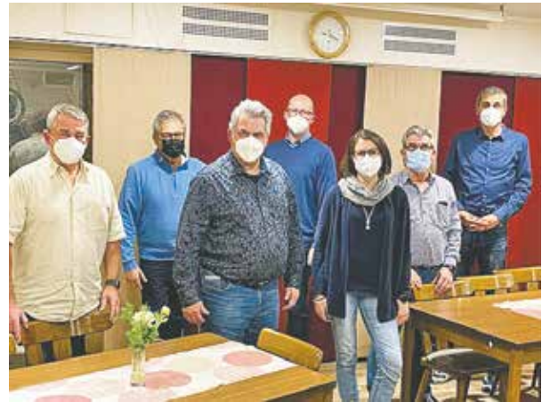
neuer Vorstand OV Pütz.