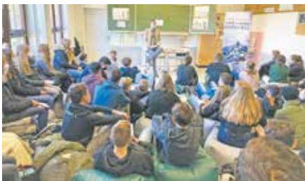
Auch externe Autoren präsentierten den Schüler*innen vom 29. November bis zum 10. Dezember 2021 ihre Werke.

Das Highlight des Festivals war der Themenabend „Heimat und Fremde – Flucht und Exil“. Begleitet von einer Ausstellung der Fachschaft Kunst, lyrischen Vorträgen eines Q1-Kurses und musikalischer Untermalung mit Klezmer-Klänge sorgte vor allem die Lesung von Peter Granzow aus seinem Roman „Salim – Ein syrischer Flüchtling bei mir zu Gast: Eine wahre Geschichte“ für große Begeisterung.