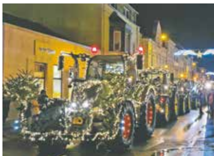
Die Bauern schmückten ihre Traktoren mit Lichterketten und Tannenzweigen.

Vom Pflegeheim „Pro8“ in Bedburg-West ging es für die Landwirte nach Lipp zum Seniorenheim „Weber“. Von dort aus machten sie sich auf den Weg über Kaster, Kirchherten und Grottenherten, vorbei an Kirchtroisdorf nach Pütz. Dort endete die weihnachtliche Aktion nach insgesamt 34 Kilometern.