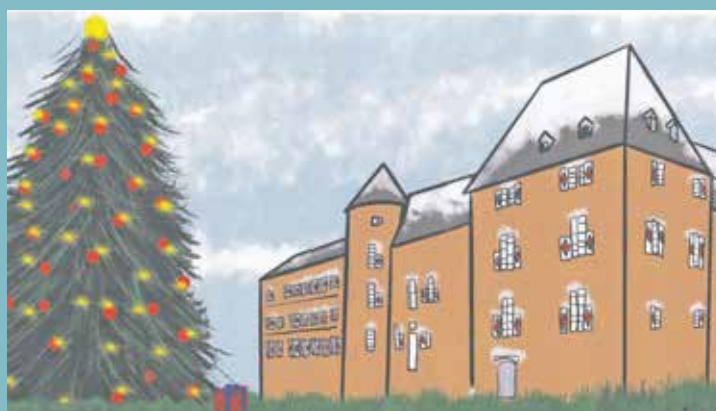
Amelie Walter vom Silverberg-Gymnasium schickt einen Weihnachtsgruß an alle Bedburgerinnen und Bedburger.

alle weiteren Infos zum Impfbus unter www.bedburg.de