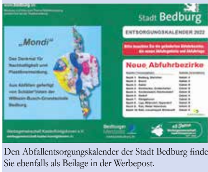
Den Abfallentsorgungskalender der Stadt Bedburg finden Sie ebenfalls als Beilage in der Werbepost.

Wer sich automatisch an seine Abfuhrtermine erinnern lassen möchte, der sollte die kostenlose MüllALARM App der Firma Schönackers nutzen. Mit der App können Sie die Termine zusätzlich mit Ihrem Kalender synchronisieren. Weitere Informationen unter www.schoenackers.de/muellalarm .