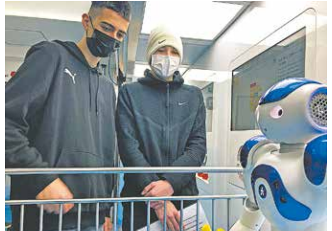
Bedburger Schüler*innen im Dialog mit einem Roboter.

churwissenschaften und Technik. Diese Wissenschaften zählen zu den innovativsten wirtschaftlichen Bereichen, weswegen die Nachfrage nach Studentinnen und Studenten mit einem Studienabschluss in diesen Fächern sehr hoch ist. Auf den zwei Etagen des Trucks gab es viel zu entdecken: An verschiedenen Stationen schnupperten die Schülerinnen und Schüler in verschiedenste Berufsfelder hinein. Dabei lernten sie zum Beispiel an der Station „Precision Farming“, wie mittels künstlicher Intelligenz einer