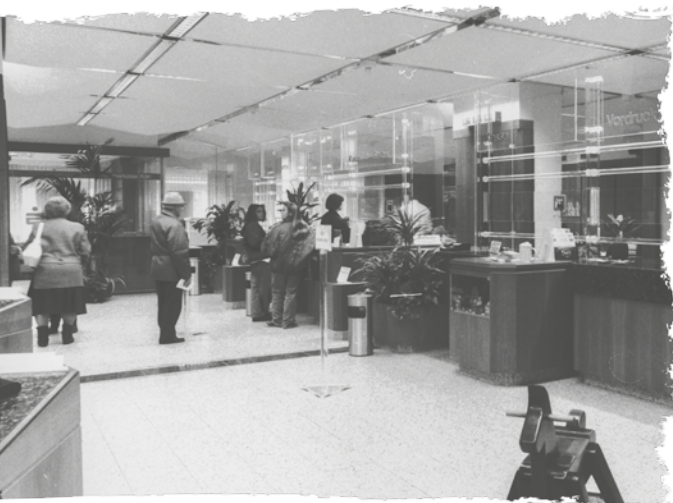
KSK Bedburg Innenansicht nach Modernisierung 1990.