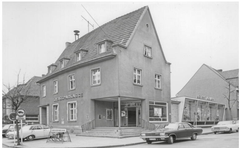
KSK Bedburg Außenansicht 1967.

Ende der 1980er Jahre ließ die Sparkasse das Bedburger Geschäftsgebäude umfassend modernisieren. Die Umbauten erfolgten in acht Teilabschnitten, um den weiterlaufenden Geschäftsverkehr möglichst wenig zu stören, und erstreckten sich über eine Gesamtbauzeit von