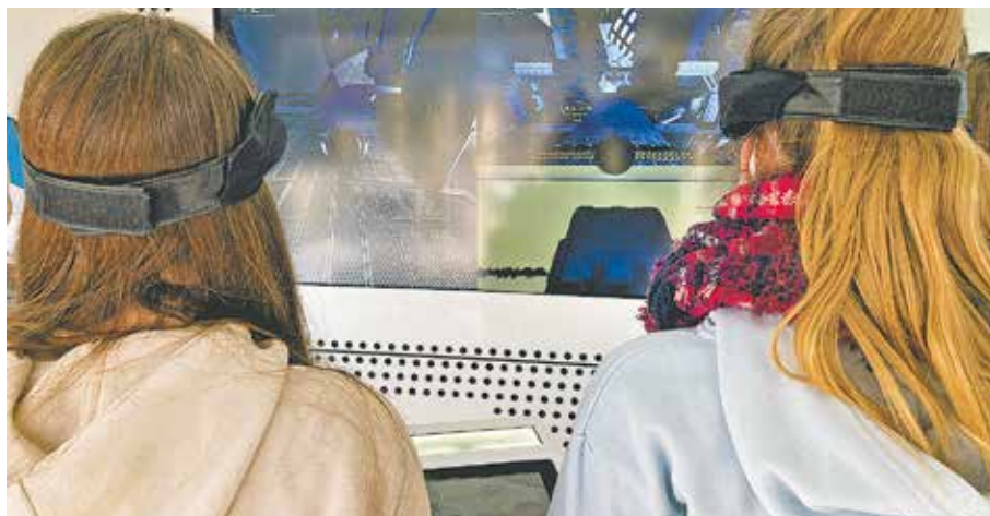
Schüler*innen steuerten digitale Kugeln über Entspannung und Konzentration.

Als MINT-freundliche Schule freut sich das Silverberg-Gymnasium jetzt schon auf den nächsten Besuch des Trucks aus der Zukunft.