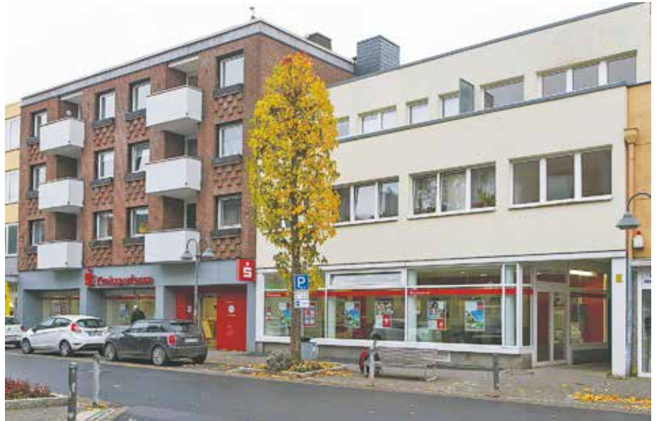
KSK Bedburg Außenansicht Nov. 2021.

Infolge der weiterhin dynamischen Geschäftsentwicklung wurden die Geschäftsräume der Filiale Bedburg zu Beginn der 1970er Jahre bald wieder zu klein. Direkt im Zentrum von Bedburg, in Schlossnähe in der Graf-Salm-Str. 40, begannen daher im Mai 1973 die rund zweijährigen Arbeiten an einem Geschäftsstellenneubau. Fast zeitgleich mit der kommunalen Neugliederung Anfang 1975 nahm die Sparkasse in dem neu errichteten