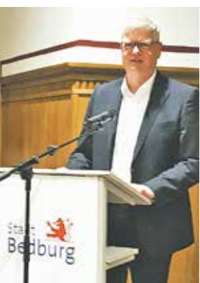
Haushaltsrede des SPD-Fraktionsvorsitzenden 2019.