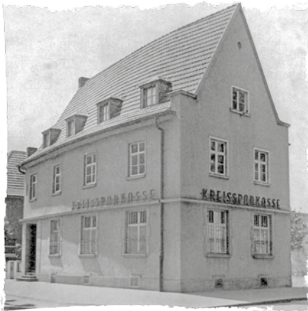
Außenansicht Neubau 1936.

Als die bisherigen Geschäftsräume nicht mehr den wachsenden Anforderungen an zeitgemäße Finanzdienstleistungen entsprachen, zog die Geschäftsstelle 1936 in einen sparkasseneigenen Neubau Ecke Lindenstraße 17 / Langemarkstraße um. Neben regelmäßigen kleineren Renovierungen erfolgte 1957/1958 ein größerer Umbau, in dessen Rahmen das Gebäude um einen unterkellerten, eingeschossigen Anbau erweitert wurde, der Eingangsbereich neu gestaltet und die Kundenräume modernisiert und neu möbliert wurden.