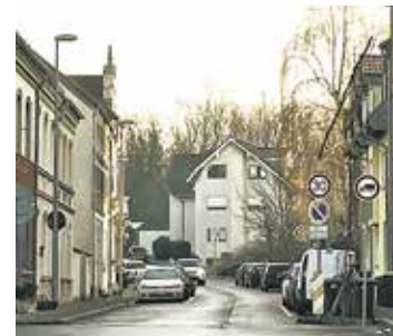
LKW-Durchfahrtsverbot auf der Kölner Straße.

Da das Ordnungsamt der Stadt Bedburg hier nicht selber tätig werden darf, wurde nun die Polizei auf die regelmäßigen Vergehen gegen das LKW-Durchfahrtsverbot aufmerksam gemacht.