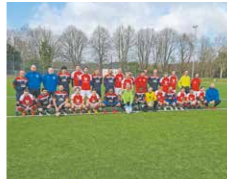
Gruppenfoto/ Teamfoto vor dem Spiel.