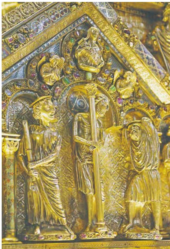
Dieses Kunstwerk findet man im Kölner Dom, es gilt als judenfeindliche Darstellung.

Und was Judas, einer seiner engsten Freunde,