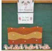
Durch ihr gutes Verhalten halfen die Kinder Erdmännchen Eddi bei der Organisation seiner Party.