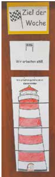
Igel Irmo konnte mit der Hilfe der Schülerinnen und Schüler den Leuchtturm erkunden.

Schon fast verzweifelt suchten die Klassenmaskottchen der Anton-Heinen-Schule nach Hilfe: Während Igel Irmo Unterstützung bei der Erkundung eines Leuchtturms benötigte, war Erdmännchen Eddi auf der Suche nach Freunden für seine Party. Zum Glück konnten die beiden dabei auf die Hilfe der Grundschul Kinder aus Kirdorf und ihr Projekt „Eine zukunftsichere Klasse(n)Gemeinschaft“ zählen.