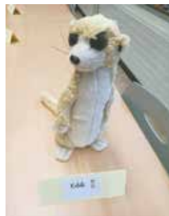
Nach dem Schulprojekt war auch Erdmännchen Eddi überglücklich.