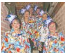
Vorstand der Katholischen Frauengemeinschaft St. Georg aus Kaster:

Maat et jood, bleibt jesungk und haldet de Uhre stief! 3 Mol Blierkem – Alaaf - Kirdörp – Alaaf Bebber-Wess – Alaaf!“