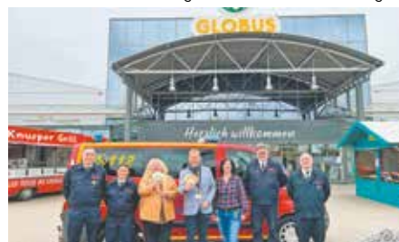
VertreterInnen des Globus-Marktes überreichen die Spende an die Mitglieder der städtischen Feuerwehr.