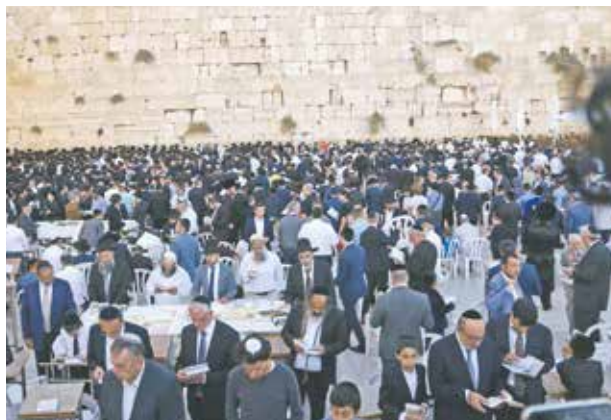
Die Westmauer, auch Klagemauer genannt, im jüdischen Tempel von Jerusalem.

An diesem dritten der „ZEHN GEBOTE“ können auch Kritiker gut lernen, wozu diese Grundregeln gut, ja lebenswichtig sind: Sie sind im wahrsten Sinne des Wortes „handfest“, schon für Kinder an den Fingern abzählbar.