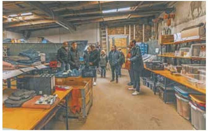
Auf seiner letzten Station besuchte der Bürgermeister die Ausgabestelle der Initiative „Eifel für Eifel“.