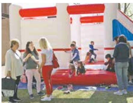
Für die geflüchteten Kinder wurde am Pfarrheim eine Hüpfburg aufgestellt.

Zukünftig soll das Café Klitschko auch weiter Treffpunkt für die geflüchteten Menschen in unserer Stadt sein. Für die Unterstützung möchten sich die Organisatoren an dieser Stelle bei Café Kraus, Getränke Lüpkes, der Fa. Globus, Trinkgut und Mars Wrigley confectionery bedanken!