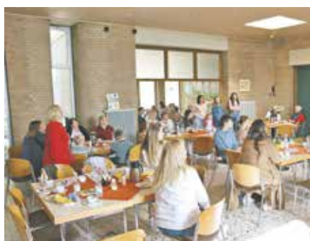
Die nächsten Termine im Café Klitschko sind am 15. und 29. Mai.