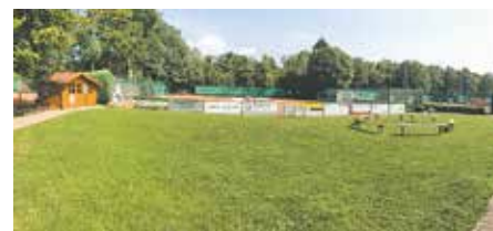
Rasenfläche und Beete zwischen Clubheim und Tennisplätzen.

Der Tennisclub freut sich über jede Rückmeldung.