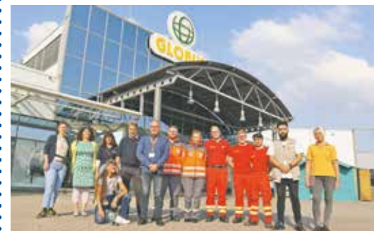
Hilfsorganisationen und Vertreterinnen der Stadt Bedburg bedankten sich beim Team vom Globus in Bedburg.

Auch das von der Stadt und den Hilfsorganisationen betriebene Flüchtlingscafé im Pfarr-