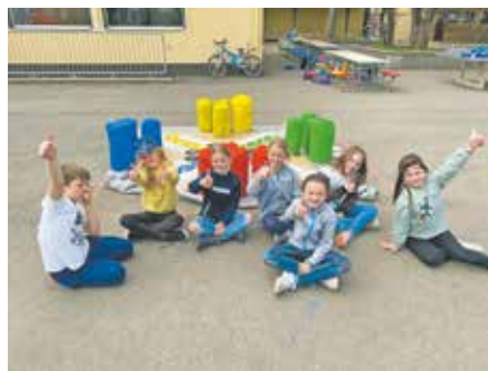
Das Anmeldefenster für die städtischen Sommerferienspiele ist geöffnet.

In der dritten Woche haben die Teilnehmerinnen und Teilnehmer die Möglichkeit, selbst Möbelstücke oder Einrichtungsgegenstände zu bauen