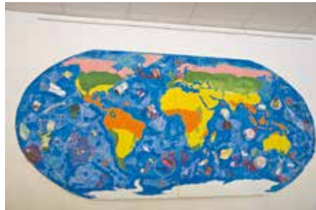
Mit dem Bild in der Mensa machen die Kinder und Jugendlichen auf die Umweltverschmutzung aufmerksam.

„Das Projektteam hat sich aus einem kreativen Blickwinkel heraus den zentralen Themen unserer Zeit gewidmet. Sie zeigen, wie wichtig Frieden in unserer Welt ist und haben sich zudem den Themen Natur- und Umweltschutz auf eine beeindruckende Weise genähert. Mit ihren Kunstwerken gelingt es den Kindern und Jugendlichen, andere zum Nachdenken und Austausch darüber anzuregen, was jeder Einzelne, aber auch wir alle gemein-