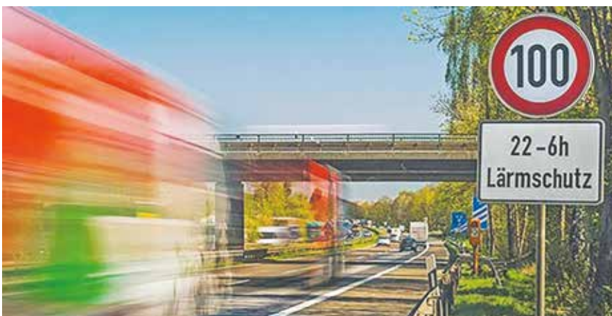
Lärmschutz durch zeitweises Tempolimit.

Lärmbelastungen zu hören. Dabei wurde mehrfach auf die bereits bestehende Lärmquelle der Autobahn A61 hingewiesen.