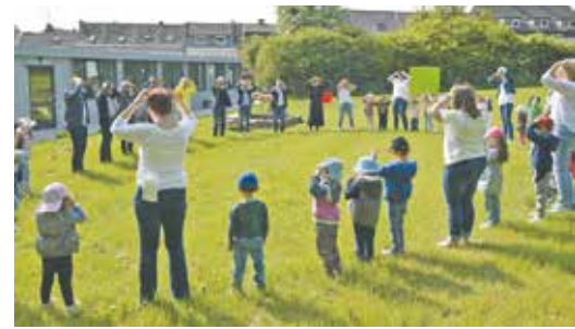
Schwerpunkt Bewegung: Die Kinder der Kita Karlstraße forderten Bürgermeister Sascha Solbach und die anderen Gäste zum gemeinsamen Eröffnungstanz auf.

Das großzügig angelegte Außengelände befindet sich in einem laufenden Prozess der bewegungsfreudigen Gestaltung, unter anderem mit Baumstämmen, transportablem Ballkorb, dem Anlegen eines Sinnes-Fuß-Pfades sowie einer Blühwiese. Ebenso haben die Kinder die Mög-