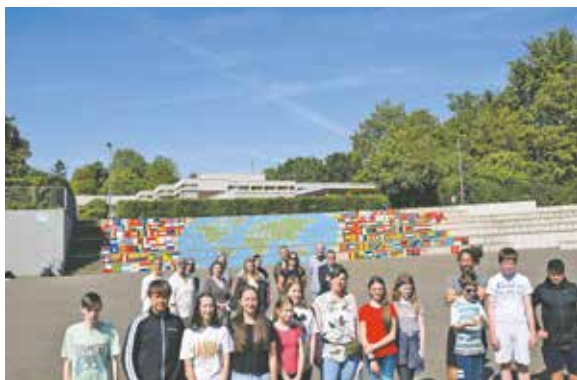
Das Kunstwerk auf der Schulhoftribüne steht für Frieden und gegen Krieg.

Die offizielle Übergabe der Kunstwerke nutzte die Projektgruppe, um sich neben den Schulleitungen und der VINCI Facilities Solutions GmbH auch bei weiteren UnterstützerInnen herzlich zu bedanken. Darunter bei der Kerpener Firma Malerwerkstätte G. Berg GmbH, die den KünstlerInnen die Farben spendete, bei der Werbeagentur Rhein-Erft aus Bedburg, die eine Vorlage für die große Weltkarte erstellte und ausdrückte, sowie bei der Stabsstelle Soziale Stadt der Stadt Bedburg, die bei den Materialkosten für das Mensabild finanziell aushalf.