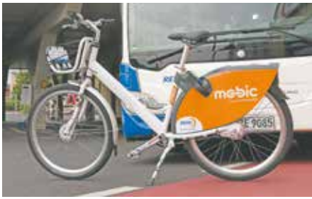
Diese Mietfahräder stehen nach den Sommerferien an drei Standorten in Bedburg zur Verfügung.

Projekt der REVG startet nach den Sommerferien