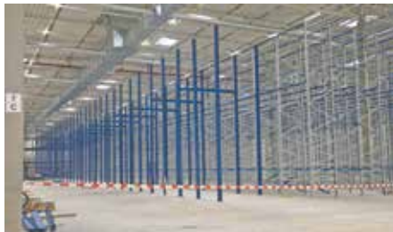
Auf diesen meterhohen Konstruktionen werden später einmal die Waren für die Verkaufshäuser hängen.