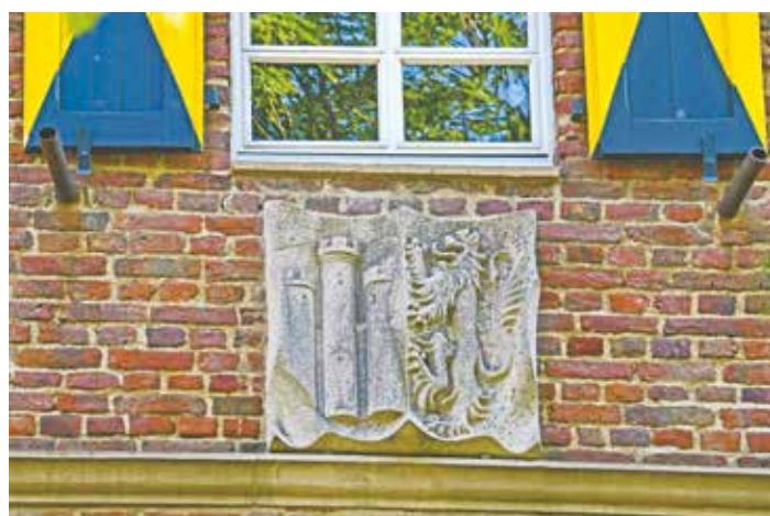
Über dem Erft-Tor von Alt-Kaster befindet sich das Wappen der Grafen und Herzöge von Jülich. © Hans Aussem

Über 100 Aussteller erwarten ihre Besucher. Neben den ungewöhnlichen Handwerkern wie Korbflechterin, Münzschnneider und Drechsler sowie Kunstgewerbe- und Kunsthandwerk, bieten fünf Straußwirtschaften und die ortsansässigen Gastronomiebetriebe kulinarische Köstlichkeiten an. Organisiert wird der Markt vom Arbeitskreis Altstadt Kaster.