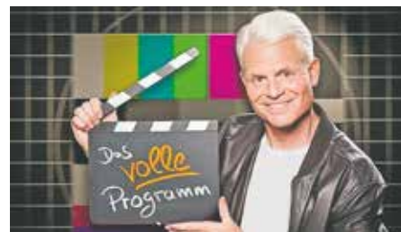
Guido Cantz kommt am 14. August ins Bedburger Freibad.