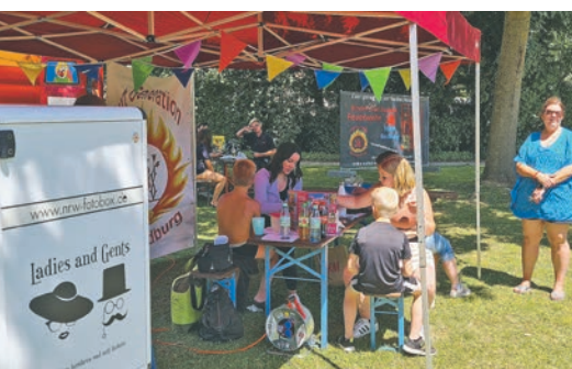
Jede Menge Spaß hatten die kleineren Gäste beim Kinderschminken.

Außerhalb des Wassers sorgte der TV Bedburg auf dem Volleyballfeld und beim Kindertanzen für Begeisterung bei Groß und Klein. Nachdem die Tänze innerhalb kürzester Zeit gemeinsam einstudiert wurden, konnten die Jungs und Mädchen die Cho-