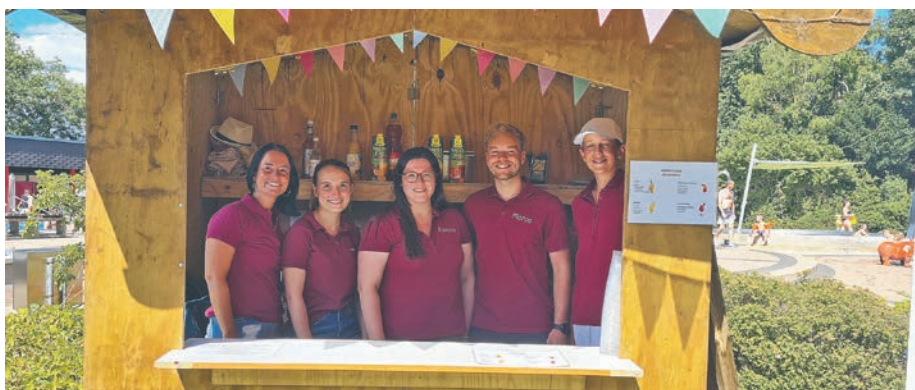
Das Team von „Jugend in 50181“ wartete mit erfrischenden Drinks und Cocktails auf.

Als Initiator und Organisator des Freibadfestes bedankt sich die Stadt Bedburg bei allen Mitarbeiterinnen und Mitarbeitern des Bedburger Freibades, bei den Ortsgruppen der DLRG aus Bedburg und Erkelenz, dem CORE, dem TV Bedburg und der städtischen Feuerwehr für die Unterstützung. Ebenso bei den Mitgliedern von „Jugend in 50181“ sowie den Sponsoren Volksbank Erft, Kreissparkasse Köln und Globus.