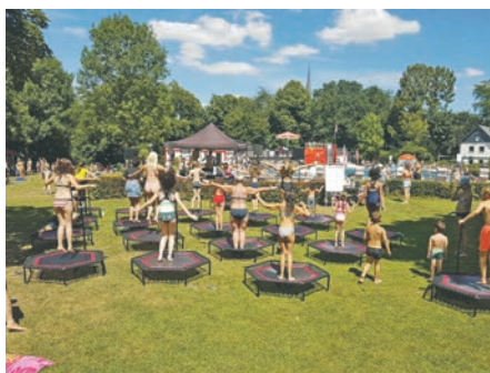
Besonders beliebt waren die Trampoline des „CORE“ Fitnessstudios.

merInnen so richtig ins Schwitzen. Unter Anleitung der Mitarbeiterinnen des neuen Therapiezentrums CORE, das zuvor unter dem Namen Weissenberger