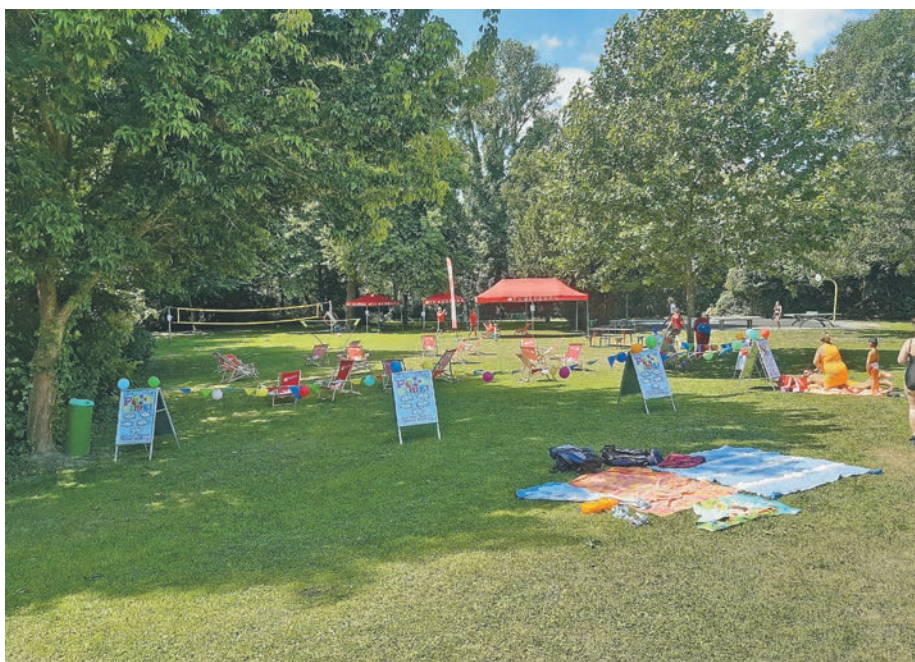
Umfangreiche Aktionswiese des TV Bedburg.

Das Fitnessstudio „CORE“ aus Bedburg bot den Gästen ebenfalls ein actionreiches Programm. Besonders die Jumping-Einheiten auf den Trampolinen waren sehr gefragt und brachten die Teilneh-