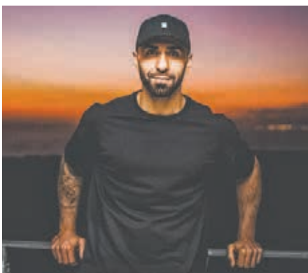
MoTrip: MoTrip ist vor allem für die jüngeren Besucher und Besucherinnen der MusikMeile ein echtes Highlight.