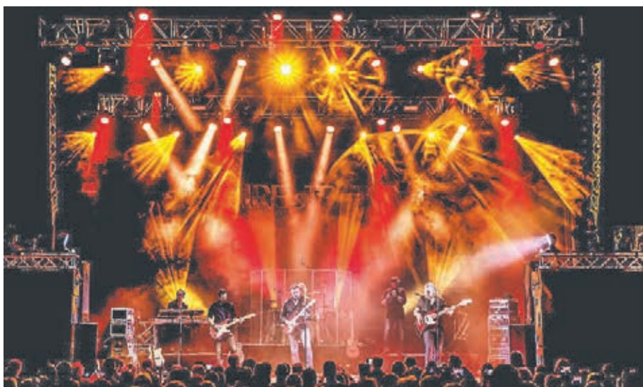
dIRE sTRATS: Die dIRE sTRATS gelten als die beste Tribute-Band der britischen Rockband Dire Straits.