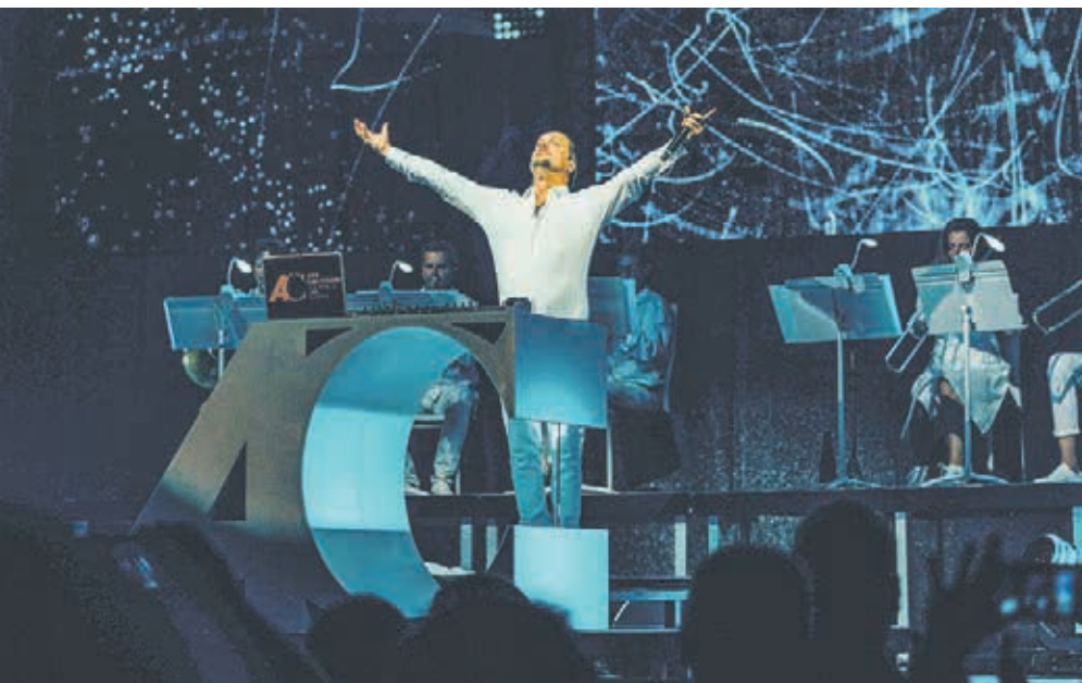
Alex Christensen: DJ und Produzent Alex Christensen hat unter anderem mit Tom Jones, Udo Lindenberg und Helene Fischer zusammengearbeitet.

Gemeinsam mit tausenden Musikfans singt, tanzt und feiert Bedburg am Samstag, dem 3. September 2022 ab 19 Uhr auf der 16. MusikMeile . Das weit über die Stadtgrenzen hinaus bekannte und beliebte Musik-Festival in der Bedburger Innenstadt lockte in den vergangenen Jahren mit Headlinern wie Milow, Christina Stürmer und Max Mutzke über 30.000 Menschen in die Stadt und war damit das musikalische Top-Event in der Region.