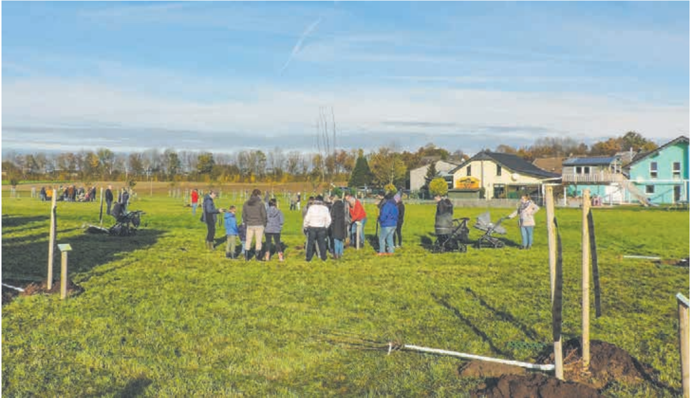
Die Storchenwiese in Grottenherten ist bei Eltern, Großeltern, Patentanten bzw. -onkel und Co. sehr beliebt.

Für frischgebackene Eltern sind glückliche Erinnerungen an die gemeinsame Zeit von großer Bedeutung. Für Kinder sind vor allem die Sensibilisierung für die Natur und deren Erhaltung wichtig. Aus diesem Grund gibt es seit ein paar Jahren die Bedburger Storchenwiese. Hier können Eltern, Großeltern, Patentanten bzw. -onkel und Co. einen Baum zur Geburt ihres Nachwuchses pflanzen.