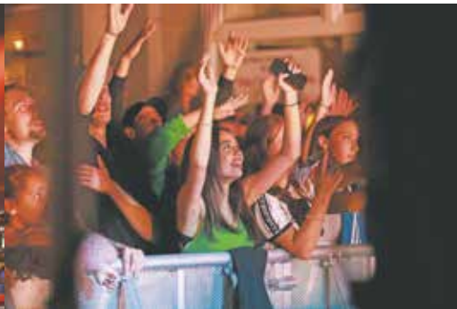
Zahlreiche Zuschauer waren vor der Rap-Bühne