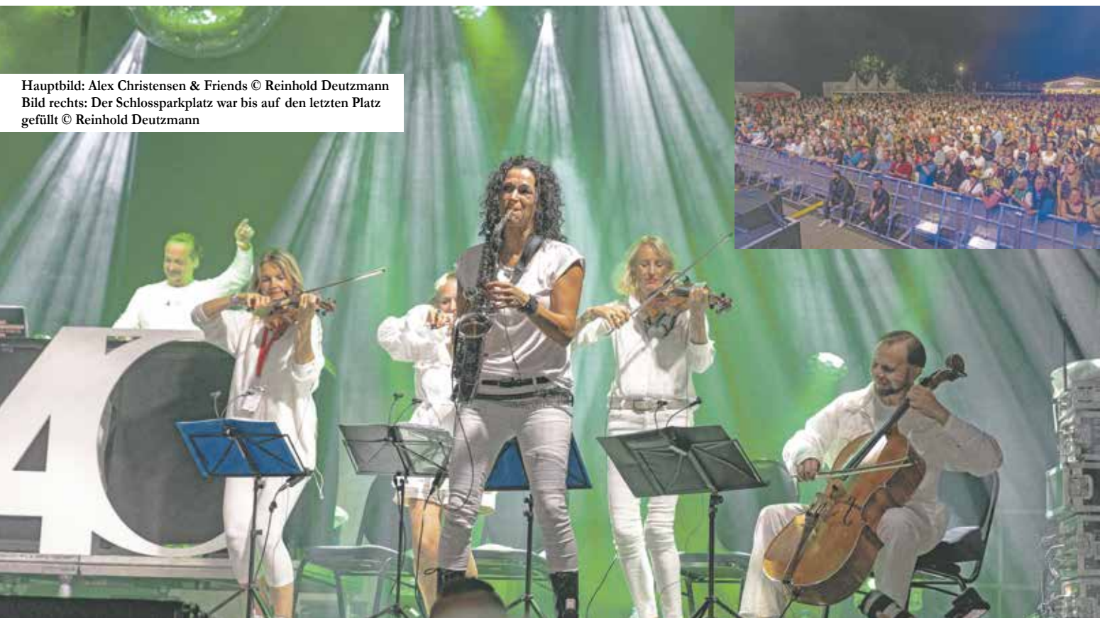
Hauptbild: Alex Christensen & Friends Bild rechts: Der Schlossparkplatz war bis auf den letzten Platz gefüllt

Zehntausende Menschen strömten am 3. September in die Bedburger Innenstadt. Bei bestem Wetter versammelten sich junge und alte Musikfans vor insgesamt neun Bühnen, um nach zwei Jahren Pause wieder die MusikMeile zu feiern. Sie bekamen bei der Rückkehr des über die Stadtgrenzen hinaus bekannten Musik-Festivals von fast 20 Bands eine großartige Show geboten.