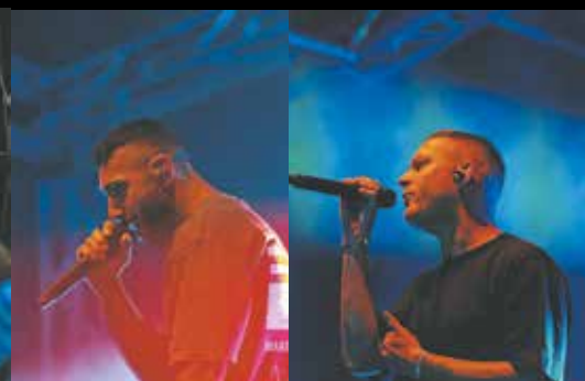
MoTrip © Nick Förster