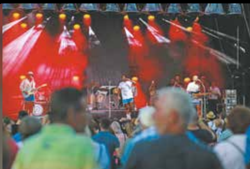
Planschmalöör © Nick Förster