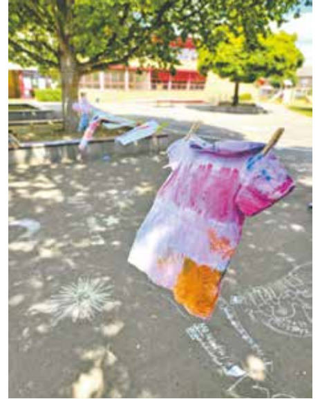
Bei den diesjährigen Herbstferienspielen können die Kinder ihren alten Kleidungsstücken neuen Glanz verleihen.

Bereits bei den abgelaufenen Sommerferien-spielen hatten die Kinder bei der Neugestaltung alter Kleidungsstücke großen Spaß. Diesmal soll das Projekt, das von einer Kulturpädagogin begleitet wird, weitergeführt werden. Ziel ist es, den Kindern Fähigkeiten zu vermitteln, um unliebsam gewordene Kleidungsstücke neu zu gestalten und damit den Kids ein Gefühl für einen nachhaltigen Konsum zu geben.