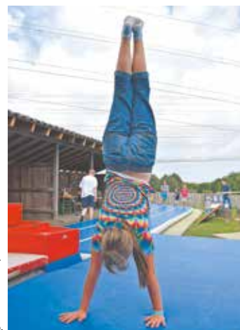
Das vielfältige Angebot sorgte bei allen Gästen für viel Spaß.

Die älteren Kinder und Jugendlichen probierten sich begeistert beim Akrobatik- und Parkourangebot des ‚Move Artistic Dome‘ aus. Auch das leibliche