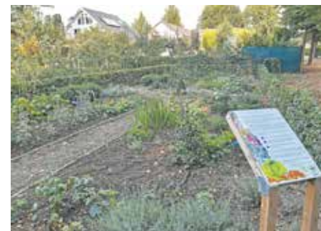
Der Bauerngarten in der alten Schlossgärtnerei konnte mit Hilfe des ISEK-Verfügungsfonds realisiert werden.

werden. Sie müssen u. a. der Gemeinschaft zugutekommen und eine positive Wirkung auf das Ortsbild haben. Die Fördersumme beträgt pro Projekt maximal 7.500 Euro (brutto).