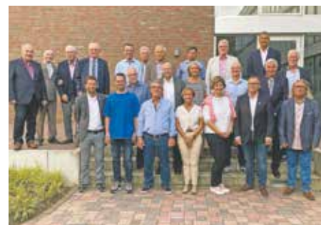
Bei einer Feierstunde im Bedburger Rathaus wurden die ehemaligen Ratsmitglieder und Ortsbürgermeister verabschiedet.

Die Ergebnisse der Kommunalwahl 2020 haben im Bedburger Stadtrat zu einem großen personel-