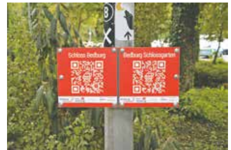
Im Schlosspark hängen bereits Schilder, die zu Informationen zum Schloss und zum Schlossgarten führen.

im Rahmen des Bundesprogramms Demokratie leben!