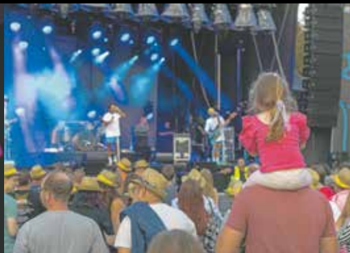
Auch die kleinen Fans feierten auf der MusikMeile