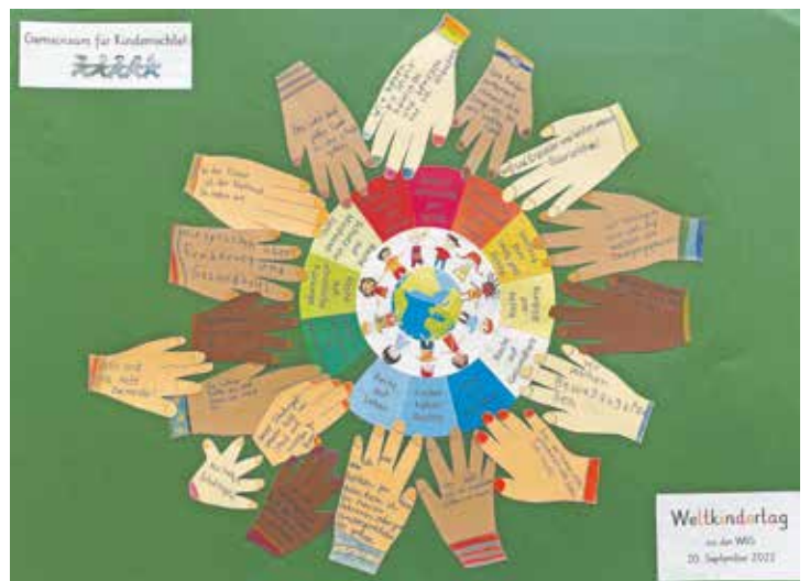
Das Kinderparlament der Wilhelm-Busch-Schule gestaltete zum Weltkindertag eine Collage.