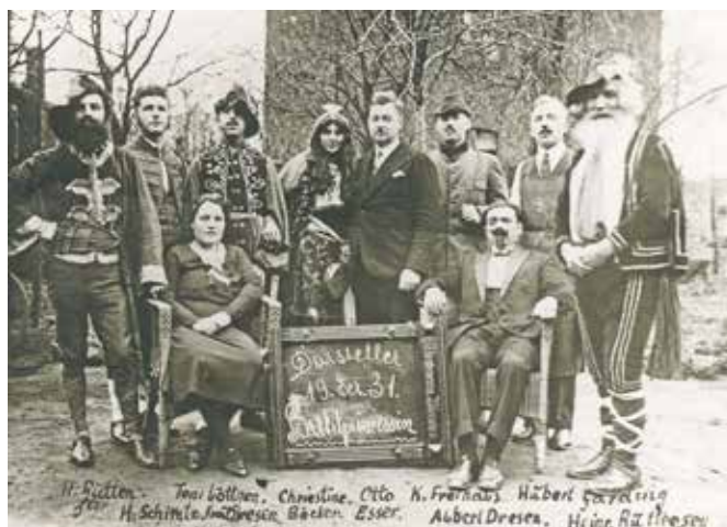
Theaterverein Blerichen von 1899, Foto von 1931

und ein Tauschgrundstück an der Klepper Gasse (heute Kolpingstraße) an, auf dem ein neues Haus mit einem zusätzlichen Unterstand für den Leichenwagen geschaffen werden sollte.