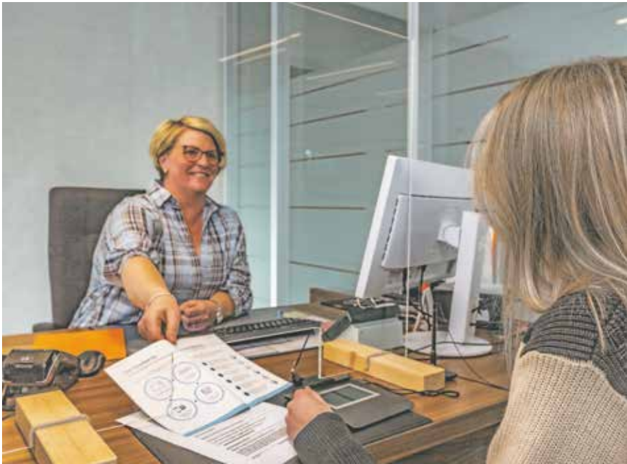
Die Stadt Bedburg freut sich auf Ihren Termin im zentralen Rathaus in Kaster.