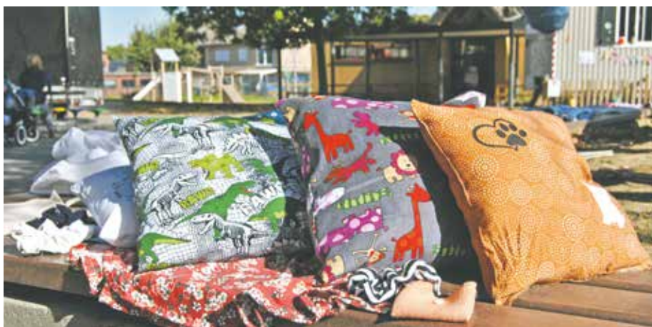
Die Kinder gestalteten während der Ferienspiele ihre eigenen Kissen.

Hüpfburg, beim Bogenschießen oder beim Axtwerfen auszutoben. „Wir konnten richtig coole Sachen machen, die Woche hat mir sehr viel