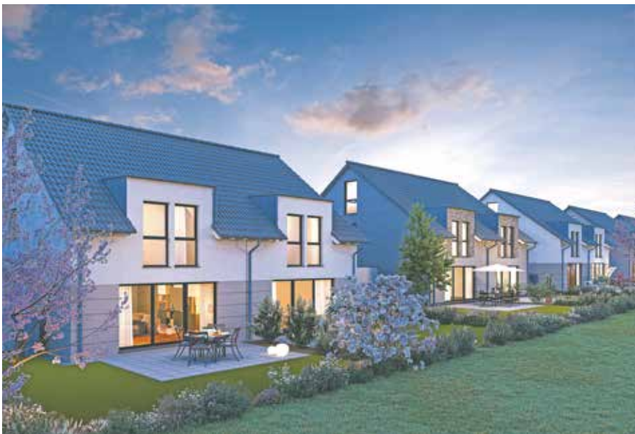
Eine Visualisierung des Neubauprojektes in Bedburg-Lipp.

Auf ca. 231 qm Grundstück werden gut 131 qm Wohnfläche und ein Untergeschoss mit über 57 qm Nutzfläche entstehen. Die Wohnfläche verteilt sich auf einen großzügigen Wohn- und Kochbereich mit Zugang zur Terrasse und Garten, ein Elternschlafzimmer, zwei Kinderzimmer und einen großen, ausgebauten Dachspeicher. Daneben verfügen die Häuser über Wannen- und Duschbäder sowie separate Gäste-WCs und