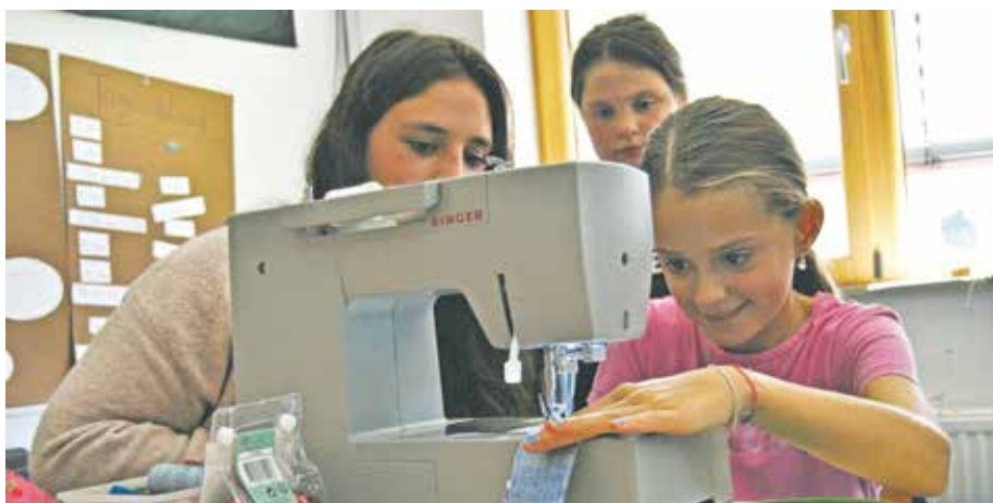
In der eigenen Textilwerkstatt lernten die Kids den Umgang mit der Nähmaschine.

Während der ersten Ferienwoche hatten die Kinder auf dem Gelände der Anton-Heinen-Schule in Kirdorf ebenfalls die Möglichkeit, sich auf der