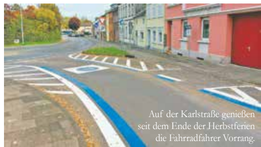
Auf der Karlstraße genießen seit dem Ende der Herbstferien die Fahrradfahrer Vorrang.

Diese Einbahnstraße wurde ebenfalls zu Schulbeginn freigegeben und ist für Autofahrer nur von der Eichendorffstraße in Richtung Adolf-Silverberg-Straße befahrbar. Fahrradfahrer können die Straße, die in den nächsten Wochen am Fahrbahnrand noch mit Obstbäumen und insektenfreundlicher Bepflanzung versehen wird, in beide Richtungen nutzen. Für Fußgänger ist weiterhin der parallel zur neuen Verbindungsstraße verlaufende Fußweg vorgesehen.