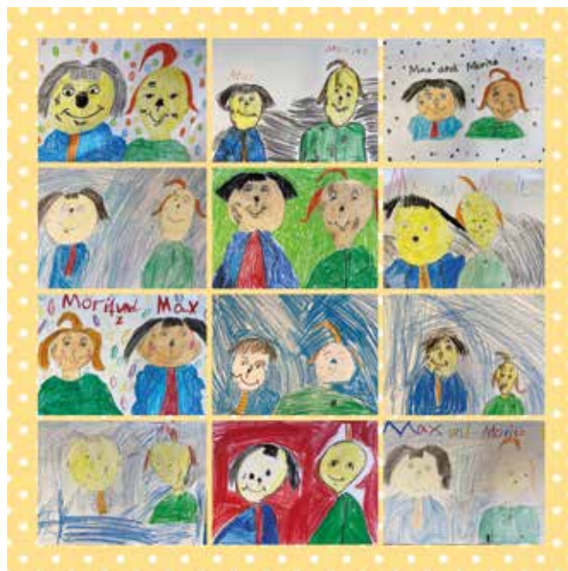
Die Kinder der Klasse 3b gestalteten eine Collage aus Portraits von Max und Moritz.