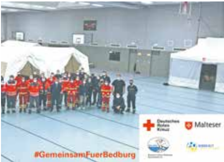
Der Angriff auf die Ukraine erschüttert seit Ende Februar die ganze Welt. Auch hier in Bedburg mussten wir uns auf die Auswirkungen des Krieges vorbereiten. In der Dreifachhalle wurde eine Notunterkunft für Flüchtlinge errichtet, die dank privater Hilfsangebote und von der Stadtverwaltung angemieteter Wohnungen nicht genutzt werden musste.