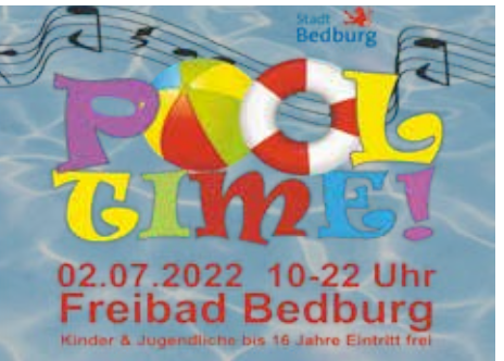
900 begeisterte Gäste kamen Anfang Juli bei strahlendem Sonnenschein zum Freibadfest Pooltime. Für zwölf Stunden verwandelte sich das Freibad in eine riesige Spielfläche, auf der von Kinderschminken bis zu einem breiten Sportprogramm alles geboten wurde. In diesem Jahr soll das Freibad mit Hilfe von Fördermitteln modernisiert und energetisch saniert werden.