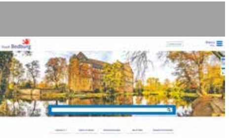
Nach einem Frühjahrsputz ging die neue Website der Stadt Bedburg Mitte des Jahres an den Start. Die neue Homepage ist nach dem Relaunch deutlich intuitiver gestaltet und ermöglicht es den Bürgerinnen und Bürgern, die gewünschten Inhalte mit wenigen Klicks abzurufen.