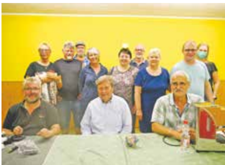
Seit der Eröffnung des Reparatur-Cafés im Mai kommen jeden vierten Freitag im Monat viele Menschen zur AWO nach Kaster, um ihre alten Schätze dort reparieren zu lassen. Das beliebte Angebot der Ehrenamtler wird in Zusammenarbeit mit der Stadtverwaltung auch in diesem Jahr fortgeführt.