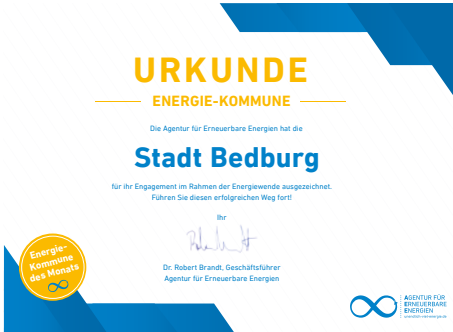
Um den Herausforderungen des Klimawandels zu begegnen, hat die Stadt Bedburg im letzten Jahr ein Klimaschutzkonzept beschlossen, mit dem das Ziel der Treibhausgasneutralität bis 2045 erreicht werden soll. Von der Agentur für Erneuerbare Energien wurden wir für unsere Projekte im Bereich des Klimaschutzes im April als Energie-Kommune des Monats ausgezeichnet.