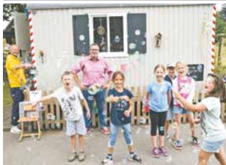
Viel Spaß und Action gab es für die Kinder unserer Stadt bei den städtischen Oster-, Sommer- und Herbstferienspielen. Dabei konnten die Kinder selbst Möbelstücke bauen, physikalische Experimente durchführen, Kleidungsstücke in ihrer Textilwerkstatt verschönern oder sich auf dem Actiongelände an der Anton-Heinen-Schule austoben.