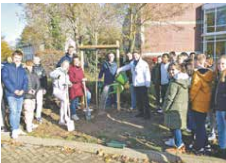
Bei der traditionellen Müllsammelaktion „Sauberes Bedburg“ befreiten erneut zahlreiche Freiwillige unsere Stadt von wildem Müll. Und auch beim CleanUp-Day des Silverberg-Gymnasiums sammelten 350 Schülerinnen und Schüler 380 Kilogramm Müll. Als Belohnung pflanzte die Stadtverwaltung in Zusammenarbeit mit dem Bauhof zwei Bäume auf dem Schulgelände.