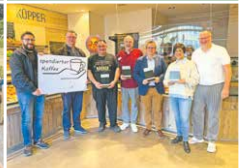
Um den Menschen zu helfen, die in der jetzigen Zeit nicht so viel Geld haben, gibt es seit dem 1. Advent den „spendierten Kaffee“. Die Bedburgerinnen und Bedburger können beim Kauf eines Kaffees, Brötchens & Co. in den Handwerksbäckereien ein weiteres Getränk oder Teilchen aufschieben lassen und jemand anderem spendieren.