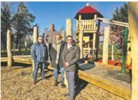
Nach Umbauarbeiten konnte im März der Spielplatz im Schlosspark wieder zurück in die Hände der Kinder gegeben werden. Neben zahlreichen Neuerungen bildet vor allem das neue Multifunktionsspielgerät, das auch von mobilitätseingeschränkten Kindern genutzt werden kann, das Highlight des Spielplatzes.