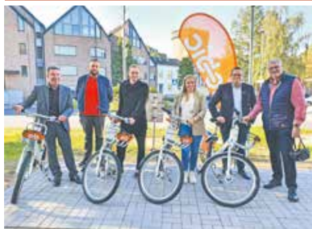
Viel getan hat sich in unserer Stadt auch für die Radfahrer. In Kooperation mit der REVG gibt es seit dem letzten Jahr drei Mietfahrrad-Stationen im Stadtgebiet, die Karlstraße am Schulzentrum wurde zur ersten Fahrradstraße in Bedburg und am Rathaus in Kaster wurden überdachte Stellplätze für die Zweiräder errichtet.