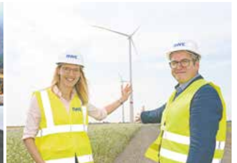
Mit dem neuen Windpark an der A 44n geht die Stadt Bedburg einen weiteren Schritt beim Thema Energiewende. Das Gemeinschaftsprojekt von Stadtverwaltung und RWE hat eine Kapazität von 28,5 Megawatt und produziert damit mehr grünen Strom als die Menschen in Bedburg verbrauchen können.