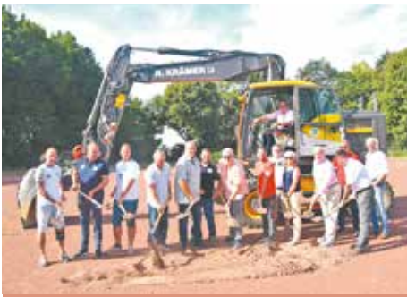
Seit August laufen die Arbeiten für die neuen Kunstrasenplätze in Kaster und Kirchherten. Die beiden Kunstrasenplätze werden mit 1,5 Millionen Euro gefördert, die restlichen Kosten trägt die Stadt Bedburg als Eigenanteil. In diesem Jahr sollen die beiden Plätze dann offiziell eröffnet werden.