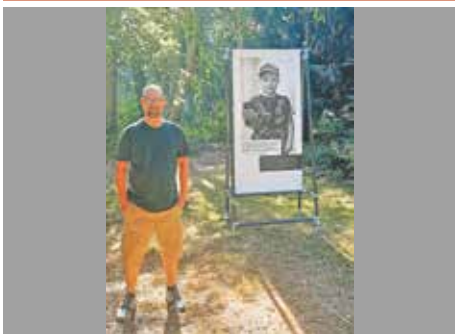
Beim Fest der Kulturen Mitte August präsentierte sich Bedburg von seiner buntesten Seite: Ukrainische, syrische und afghanische Tänze trafen auf Seemannslieder des Shanty-Chores, europäische Spezialitäten auf afrikanische Köstlichkeiten. Fotograf Matthias Sandmann präsentierte zudem seine berührende Ausstellung „Gesichter der Flucht“ mit Porträts ukrainischer Flüchtlinge.