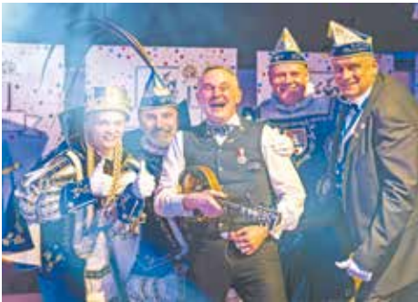
Der so geliebte Straßenkarneval fiel zu Beginn des Jahres noch der Corona-Pandemie zum Opfer. Doch mit großer Hoffnung blickten die vielen Karnevalisten bereits auf die neue Session. Diese konnte dann bei der Prinzenproklamation im November vom neuen Dreigestirn stimmungsvoll eingeläutet werden.