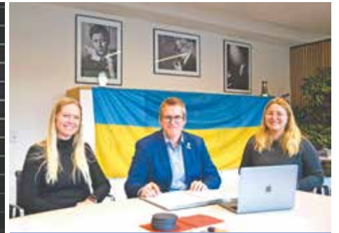
Verschiedene Bedburger Initiativen kümmern sich um die ukrainischen Flüchtlinge, die seit Beginn des Krieges zu uns gekommen sind. Viele von ihnen stammen aus der Großstadt Mykolajiw, die fast dauerhaft unter Beschuss steht. Um die Stadt weiterhin zu unterstützen, gingen Bedburg und Mykolajiw, Anfang November eine sogenannte Solidaritätspartnerschaft ein.