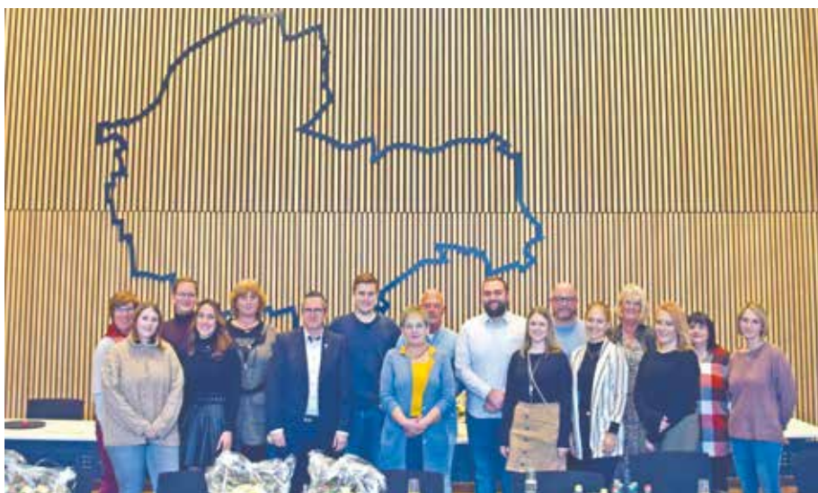
Bürgermeister Sascha Solbach ehrte Mitarbeiterinnen und Mitarbeiter der Stadtverwaltung.

Im Rahmen einer Feier im Ratssaal hat die Stadt Bedburg 23 Mitarbeiterinnen und Mitarbeiter für verschiedene Beförderungen und Dienstjubiläen geehrt. Bürgermeister Sascha Solbach nahm