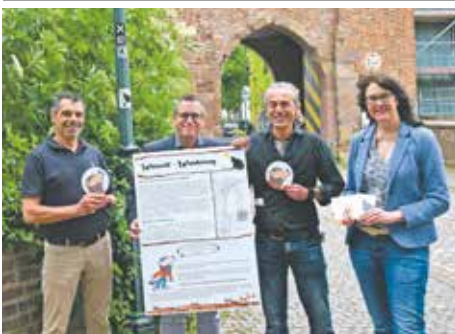
Im Sommer wurde der beliebte Wanderweg mit neuen Stationstafeln ausgestattet. Extra für die kleinen Wanderer wurde ein informativer Kinderteil mit einem spannenden Kinderrätsel rund um den Werwolf von Epprath integriert. Wer das Rätsel aus dem Werwolf-Comic löst, kann sich seinen persönlichen Werwolf-Schatz abholen.