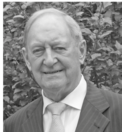
Der ehemalige Bürgermeister Willy Harren verstarb am 27. Dezember 2022.

Neben seinem großen Engagement für die Mitbürgerinnen und Mitbürger sowie die Entwicklung der Stadt Bedburg hat er sich auch auf Ebene des Rhein-Erft-Kreises viele Jahre im Kreistag sowie als stellvertretender Landrat für die Menschen eingebracht. Am 18.09.2009 wurden ihm aufgrund seiner besonderen Verdienste um die Stadt Bedburg die Ehrenbürgerrechte der Stadt verliehen.