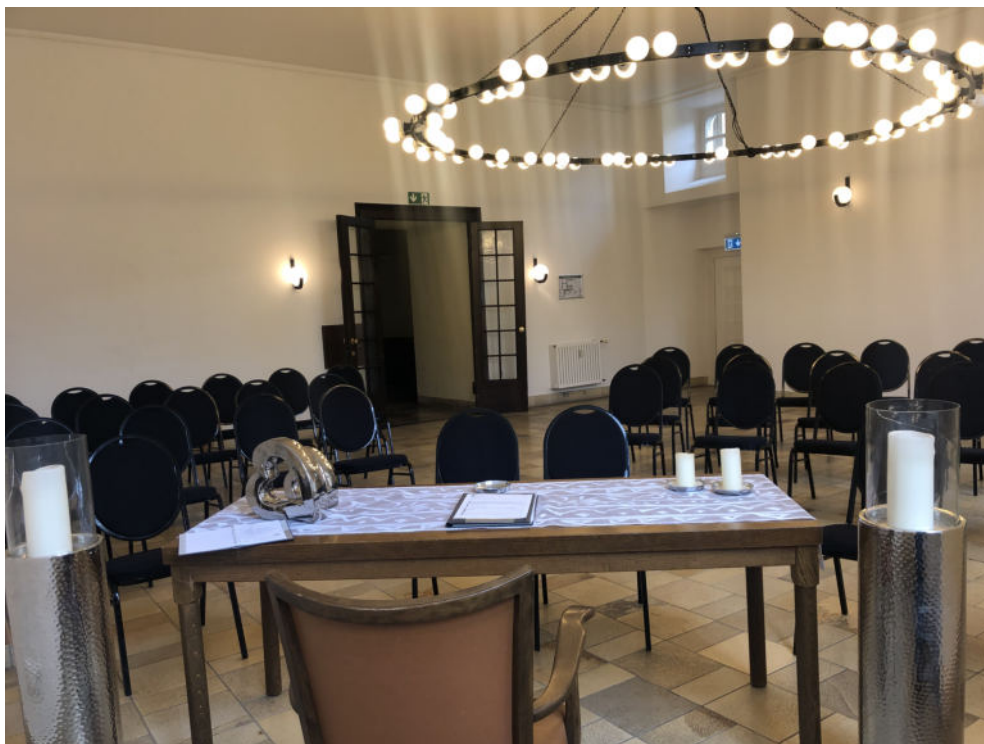
Delfterzimmer mit Kronleuchter

Die Kosten für die Buchung des Delfterzimmers betragen 300,00 € .