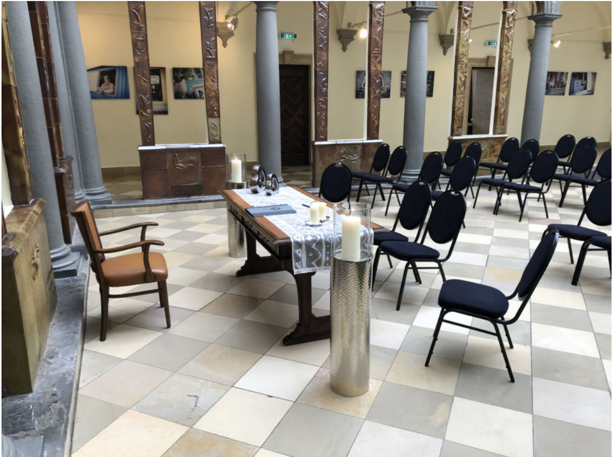
Arkadenhof – Seitenblick

Für die Buchung des Arkadenhofs werden 350,00 € fällig.