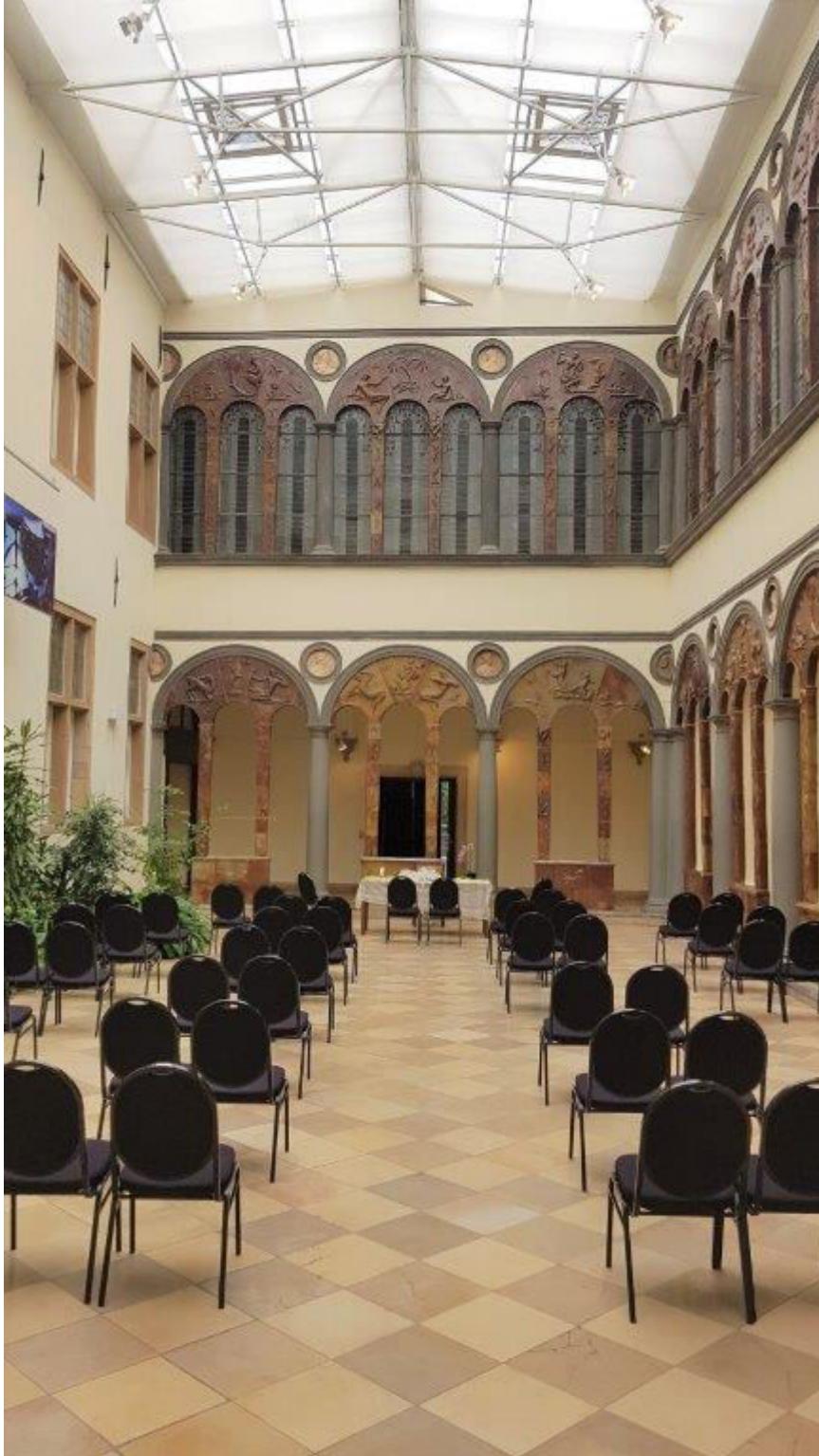
der Arkadenhof – Aussicht der Gäste

Mit seinen ca. 145 Quadratmetern Flächen finden hier bis zu 120 Personen Platz, also Platz genug auch für größere Hochzeitsgesellschaften