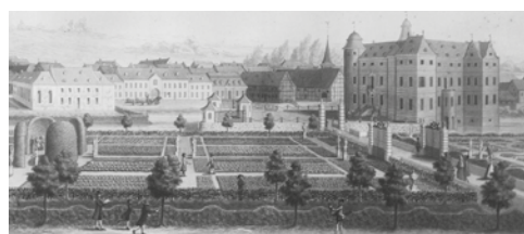
Das Bild zeigt den Bedburger Schlossgarten vor ungefähr 100 Jahren. Hier geht's direkt zum Quiz

Als die Wikinger Mitte der 830er-Jahre an den Rhein vorrückten, überraschten sie eine ungeschützte Landbevölkerung. Sie konnten ohne nennenswerte Gegenwehr ihre Raubzüge durchführen. Besonders hart traf es die Klöster, denn deren Schätze waren gefragt. Die Besitzungen der Mönche der Abtei Prüm waren von den Plünderungen auch betroffen. Nachdem die Wikinger abgezogen waren, überprüften die Mönche ihre Besitzungen und erstellten ein umfassendes Verzeichnis ihres Besitzes. In diesem Verzeichnis, Prümer Urbar genannt, erschien im Jahr 893 auch der Name Bedburg. Die Bedburger waren dem Kloster abgabenpflichtig, was in dem Verzeichnis aufgelistet wurde. Das Jahr 893 ist der früheste Zeitpunkt, zu dem man schriftlich Bedburg nachweisen kann. Somit kann Bedburg heute auf eine 1130-jährige Geschichte zurückblicken. Zu diesem Jubiläum hat der Verein für Geschichte und Heimatkunde Bedburg e.V. ein kleines Quiz erstellt, das auf der Homepage des Geschichtsvereins zu finden ist. Viel Spaß!