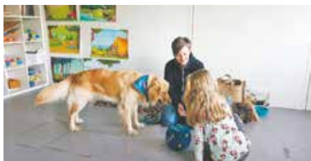
Die Kinder der Kita Blumenwiese erlebten eine spannende und unterhaltsame Projektwoche.

Rund 40 Kinder zwischen drei und sechs Jahren nahmen an dem Projekt teil. Das Konzept der Projektwoche ist zudem so angelegt, dass man es jederzeit ganz oder in Teilen wiederholen kann. So können auch die zukünftigen Kinder der Kita Blumenwiese den Zauberwald unsicher machen.