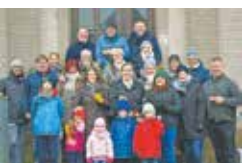
Die Gründungsmitglieder mit Familien.

gemeinschaftliche Aktionen durch aktive MitgliederInnen entwickeln lassen. Interessierte BürgerInnen, idealerweise aus Lipp, Millendorf und Oppendorf, von Jung bis Alt sind herzlich eingeladen, Kontakt zur neuen Dorfgemeinschaft aufzunehmen. Der Mitgliedsbeitrag ist mit 24 € pro Jahr bewusst niedrig gewählt und Kinder und Jugendliche bis 18 Jahre werden bei Anmeldung beitragsfrei als Mitglieder geführt. Die Satzung, einen Mitgliedsantrag und weitere Informationen können unter der Emailadresse dglm@gmx.de oder telefonisch bei den beiden Vorsitzenden angefragt werden. Besuchen Sie uns auch gerne auf unserer Facebook Seite „Dorfgemeinschaft Lipp-Millendorf-Oppendorf“.