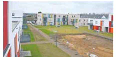
Im umzäunten Bereich entsteht in den nächsten Monaten ein Spielplatz.

Innenhof mit großem Spielplatz für die Kinder. Die Wohnungen, von denen einige auch für Rollstuhlfahrer geeignet sind, sind mit zwei bis vier Zimmern ausgestattet, 59 bis 98 m 2 groß und bieten Fußbodenheizung, bodentiefe Fenster, ebenerdige Dusche sowie Terrasse oder Balkon. Die Gebäude sind zudem energetisch optimiert. So entstehen nur geringe Heizkosten. PKW-Stellplätze gibt es sowohl in einer Tiefgarage als auch im Wohngebiet selbst. Dabei stehen auch eigene Stellplätze für Elektrofahrzeuge samt Ladeinfrastruktur zur Verfügung.