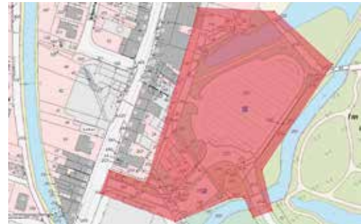
Die Glasverbotszone ist in diesem Bild rot markiert.

Nach zwei Jahren Pause ist der Sitzungs- und Straßenkarneval auch in Bedburg wieder zurück. Um dabei die Sicherheit aller Feiernden zu gewährleisten und Beeinträchtigungen möglichst gering zu halten, gilt während der Karnevalsveranstaltungen in diesem Jahr rund um den Bedburger Schlossparkplatz ein Glasverbot. Die Glasverbotszone erstreckt sich von der Zufahrtsstraße zum Schlossparkplatz ab Ecke Lindenstraße über den Schlossparkplatz bis zum Bedburger Schloss und wird entsprechend ausgeschildert.