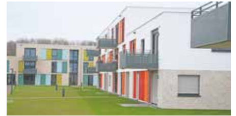
Das Sonnenfeld ist zum größten Teil bereits bewohnt.

Die sechs Gebäude der im nördlichen Rhein-Erft-Kreis tätigen Erftland kommunale Wohnungsgesellschaft mbH im Mittelteil des neuen Wohngebiets gruppieren sich um einen begrünten