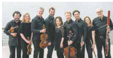
Die Musikerinnen und Musiker der KammerMusikKöln spielen am 11. März auf Schloss Bedburg.