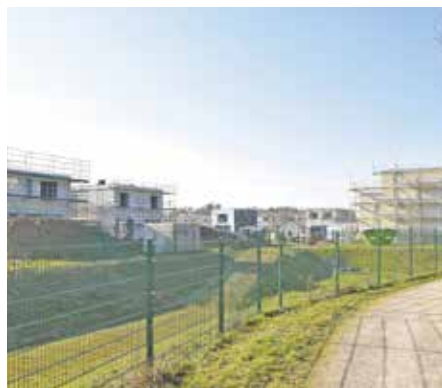
In der Ressourcenschutzsiedlung stehen drei Grundstücke zur Verfügung.

In dem zu weiten Teilen bereits bewohnten Baugebiet Sonnenfeld stehen sechs weitere Grundstücke zur Verfügung. Direkt neben dem Schwimmbad monte mare entsteht ein bunter Mix aus Einfamilienhäusern, Doppelhaushälften und Mehrfamilienhäusern. Dabei gibt es bei diesem Losverfahren erstmals die Möglichkeit, eines der Grundstücke im Erbbaurecht zu übernehmen. Der Erbpachtzins liegt hier bei 4,43 Euro pro m 2 jährlich.