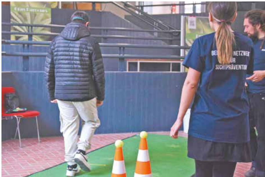
Bei der Projektwoche konnten die Schülerinnen und Schüler unter anderem einen Parcours mit einer Drogen- bzw. Rauschbrille durchlaufen.

Aus diesem Grund veranstaltete das Bedburger Netzwerk für Prävention bereits zum siebten Mal den „Gras Parcours“ am Bedburger Schulzentrum. Vom 6. bis zum 10. März konnten die SchülerInnen der 7. und 8. Klassen der drei weiterführenden Schulen den Parcours unter fachkundiger Anleitung durchlaufen und sich dabei mit dem Thema Cannabis auseinandersetzen.