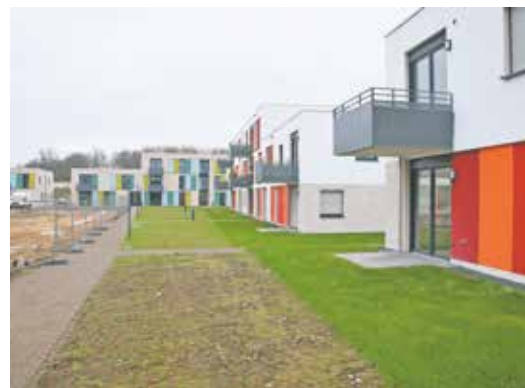
Im Sonnenfeld werden insgesamt sechs weitere Grundstücke verlost.

• Postalische Bewerbung – Alle, die sich per Post bewerben möchten, sind dazu aufgerufen, den Interessentenbogen, der unter www.bedburg.de (Bereich „Aktuelles“ oder unter