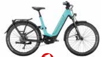
Victoria Elektro-Rad eManufaktur 12.8 statt 4.099€