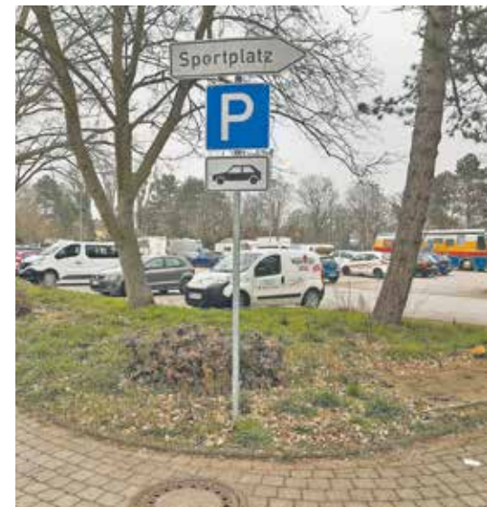
Das Parken am Sportpark Epprath ist nur noch für PKWs bis 3,5 Tonnen zulässig.

Wir weisen darauf hin, dass das Parken auf dem Parkplatz am Sportpark Epprath (Albert-Schweitzer-Straße) ab sofort nur noch für PKWs bis 3,5 Tonnen zulässig ist. Die Beschilderung an den beiden Zufahrten zum Parkplatz wurden entsprechend angepasst. Wir bitten um Beachtung und Verständnis.