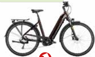
Victoria Elektro-Rad eTrekking 12.8 statt 3.599€