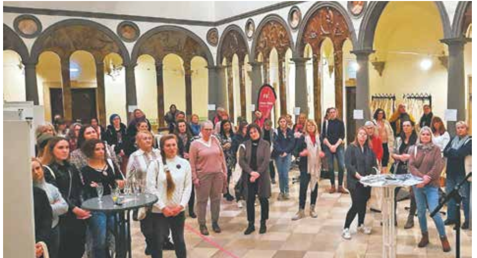
Rund 100 Frauen kamen am Weltfrauentag ins Bedburger Schloss.

„Wir wollen am Weltfrauentag ebenso ernste