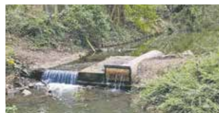
Die Wehranlage – gelegen auf Höhe der kleinen Brücke zwischen dem Hotel Bedburger Mühle und dem Schlosspark – wurde mutwillig beschädigt.

vereins helfen. Auch bei weiteren verdächtigen Beobachtungen können Sie gerne Kontakt zu den Kolleginnen und Kollegen der Polizei aufnehmen. Der Verein freut sich über jeden Hinweis.