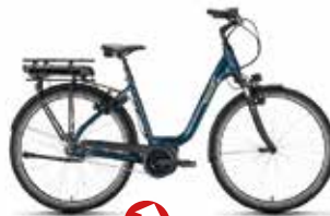
Victoria Elektro-Rad eRad Cysalo 9 statt 2.499€