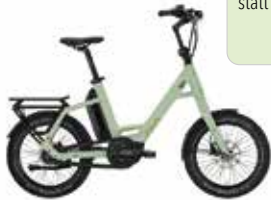
Victoria Elektro-Rad Qio Eins A-8 statt 3.199€