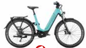
Victoria Elektro-Rad eManufaktur 12.8 statt 4.099€