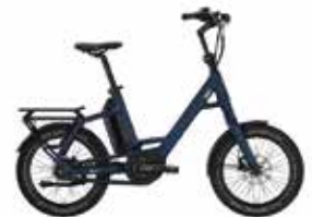
Victoria Elektro-Rad Qio Eins Ap-8 statt 3.599€