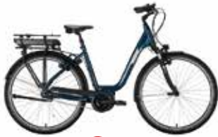
Victoria Elektro-Rad eTrekking 5.8 statt 2.299€