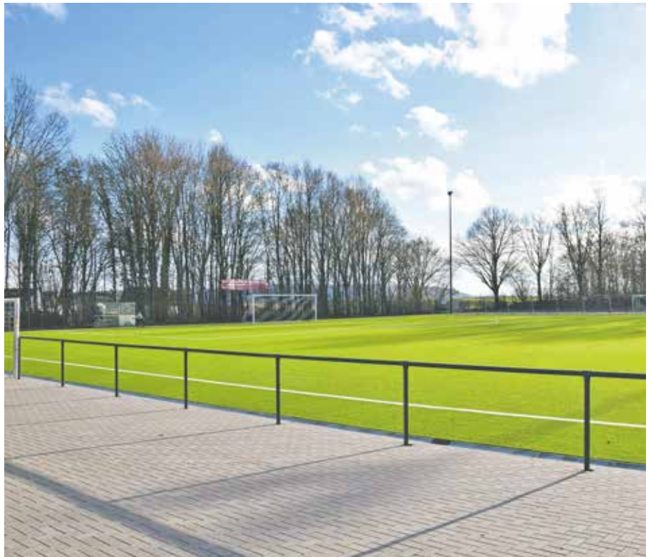
Der neue Kunstrasenplatz macht einen ganzjährigen Spiel- und Trainingsbetrieb möglich.

Kunstrasenplatz wurde auch eine neue LED-Flutlichtanlage errichtet. Für die Kinder der Geschwister-Stern-Schule wird auf der Anlage noch