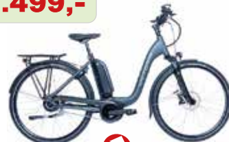
Victoria Elektro-Rad eManufaktur 9.4 statt 2.899€