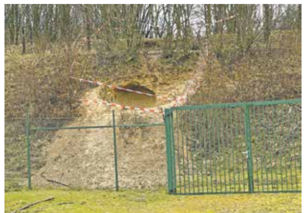
Diese selbstgebaute Höhle in Kaster wurde verschlossen.

wir noch einmal eindringlich darum, keine weiteren Höhlen zu bauen und das Thema mit den eigenen Kindern zu besprechen. Nur so kann verhindert werden, dass Personen zu Schaden kommen oder verschüttet werden. Zudem leistet die Bepflanzung einen wesentlichen Beitrag zur Stabilität der Böschung.