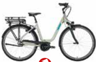
Victoria Elektro-Rad eTrekking 5.10 statt 2.599€