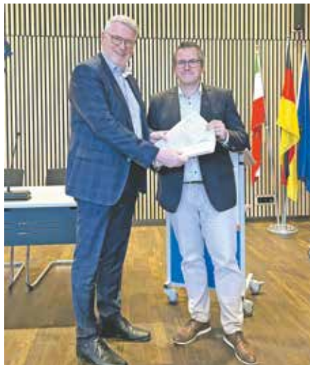
Übergabe SPD-Antrag an Bürgermeister Sascha Solbach

Die SPD hat inzwischen einen Antrag zur Beruhigung der Kolpingstraße formuliert, der den festgestellten Bürgerwillen wiedergibt. Dieser Antrag wurde zusammen mit den Ergebnissen der Bürger-Umfrage inzwischen an Bürgermeister Sascha Solbach übergeben. Es ist nun die Aufgabe der Verwaltung und der lokalen Politik, den Bürgerwillen in eine Lösung umzusetzen, die möglichst für alle akzeptabel ist.