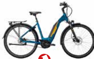
Victoria Elektro-Rad eTrekking 7.8 statt 3.399€