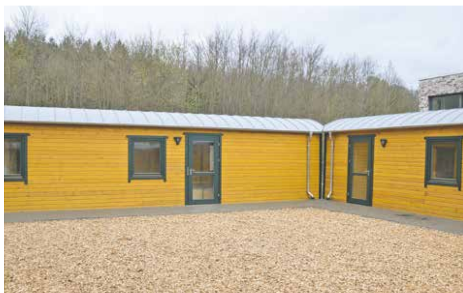
Dank der vier neuen Wichtelwagen können ab Sommer bis zu 60 Kinder im Kindergarten „Waldwichtel“ betreut werden.

Im Mai 2021 hatte die Stadt Bedburg die Trägerchaft für den Waldkindergarten übernommen. Neben dem Waldkindergarten sind mit der Kita Blumenwiese, dem Montessori-Kinderhaus und der Kita Karlstraße drei weitere Einrichtungen in städtischer Hand. Noch vor den Sommerferien soll es anlässlich der Erweiterung eine große Eröffnungsfeier für die neuen Wagen im Waldkindergarten geben.