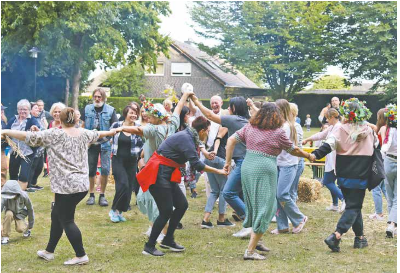
Beim Café Klitschko wurde am Iwan-Kupala-Tag, dem ukrainischen Fest zum Tag der Sommersonnenwende, gemeinsam gefeiert und getanzt.

vile Bevölkerung sammeln und an die Hilfskräfte vor Ort übergeben: Stromgeneratoren, Feldbetten, Decken, Schuhe und Hygiene-Artikel.