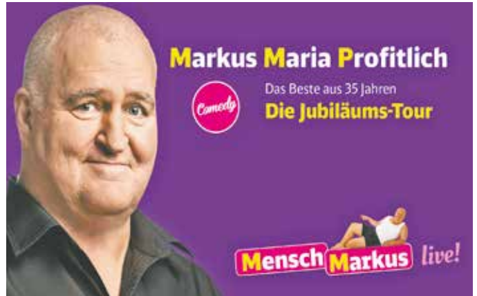
Markus Maria Profitlich kommt mit seinem Jubiläumsprogramm nach Bedburg

Karten zur Veranstaltung bekommen Sie für 23 Euro über den Online-Ticketshop auf www.bedburg.de sowie an allen bekannten Vorverkaufsstellen (Rathaus Kaster, Schreibwaren Wassenberg, Schuhservice Gatzen, Schloss Apotheke).