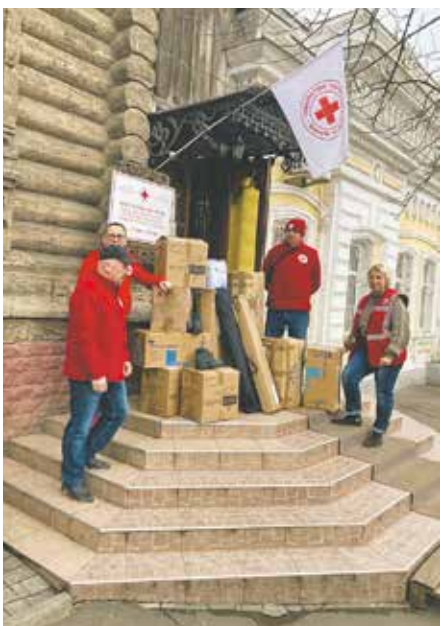
Die Mykolajiw-Hilfe brachte und bringt auch weiterhin Spenden in die Ukraine.

menarbeit mit der Stadt Mykolajiw zu verbessern, planen wir derzeit die Gründung eines Städtepartnerschaftsvereins in Bedburg. Der Zweck dieses Vereins wird die Förderung und Pflege aller Städtepartnerschaften von Bedburg sein, auf kultureller, sportlicher und sozialer Ebene. Dabei würden wir uns über jede Unterstützung freuen – kommen Sie daher gerne am 19. Juni ab 18 Uhr ins Bedburger Schloss. Gemeinsam können wir viel schaffen!