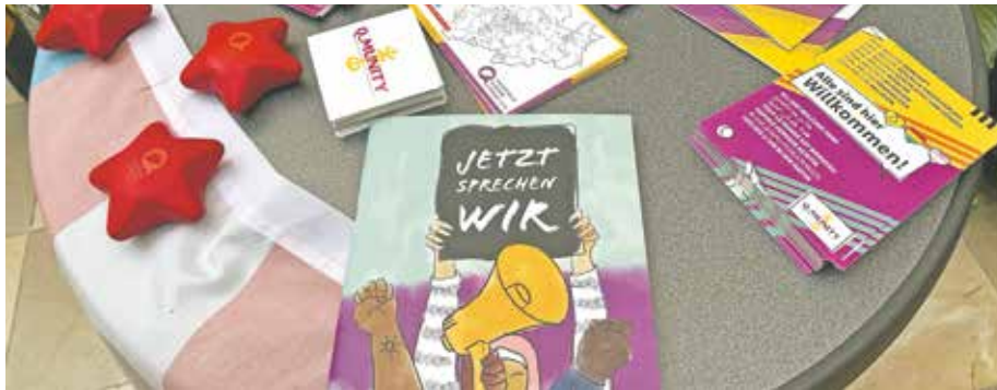
Die Angebote von und für die queere Community werden sehr gut angenommen.

Die queeren Organisationen Q-Munity der Fachstelle Queeres Netzwerk NRW und Mehr als Queer aus Köln waren zu Besuch. Sie beantworteten Fragen und stellten ihre Angebote für die queere Community vor. Auch der Bedburger Queertreff war mit Stand und Informationsbroschüre vertreten. Im