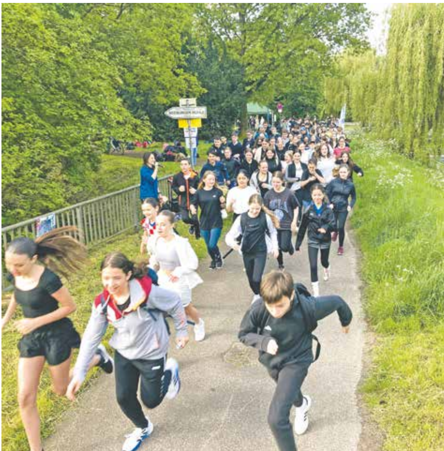
Ob auf dem Rad, auf Inlinern, im Becken oder zu Fuß – jeder Kilometer brachte mehr Geld für die Erdbebenopfer in Syrien und der Türkei.