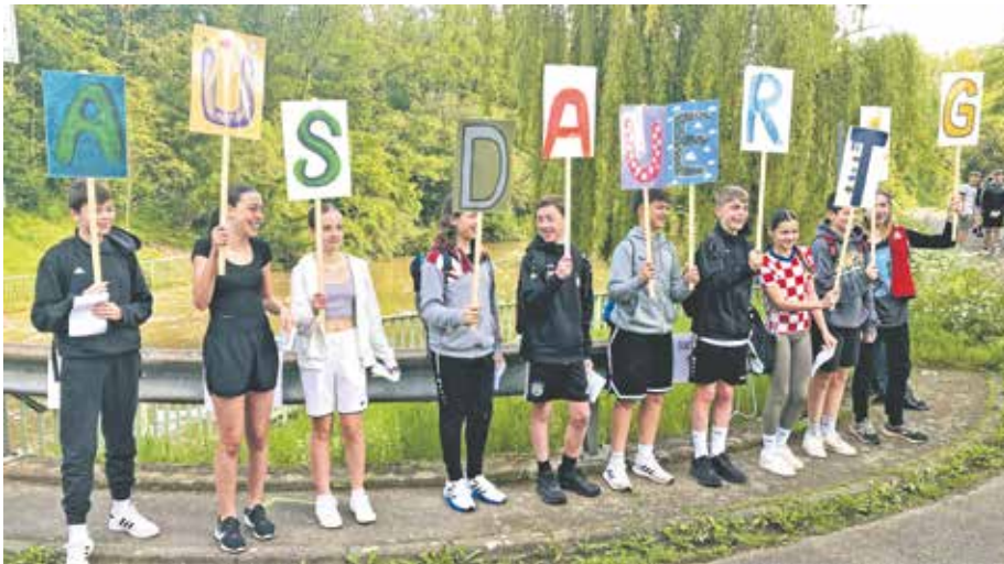
Gute Laune bei den Schülerinnen und Schülern des Silverberg-Gymnasiums: Beim Ausdaueritag stand die Freude an der gemeinsamen Bewegung im Vordergrund.

Insgesamt stand neben der Leistung und dem Spendenzweck vor allem die Freude an der gemeinsamen Bewegung im Vordergrund. Das Silverberg-Gymnasium freut sich deshalb schon jetzt auf den nächsten Ausdaueritag.