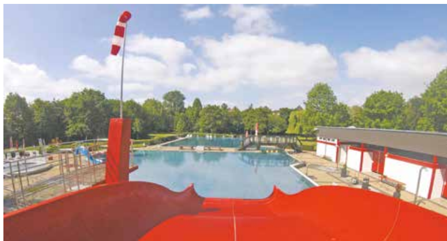
Seit dem 7. Juni heißt es im Bedburger Freibad wieder: schwimmen, planschen, rutschen und entspannen.

Die Stadt Bedburg und das Badpersonal freuen sich auf die diesjährige Freibadsaison – so wie Sie hoffentlich auch!