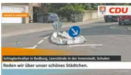
Schlaglochreparatur in Bedburg, Leerstände in der Innenstadt, Schulen Reden wir über unser schönes Städtchen.

Die CDU Bedburg weist darauf hin, dass kurzfristige Änderungen immer möglich sind und empfiehlt einen regelmäßigen Blick auf die Homepage www.cdu-bedburg.de . Folgen Sie der CDU Bedburg ebenso bei facebook und instagram , um immer auf Ballhöhe zu bleiben.