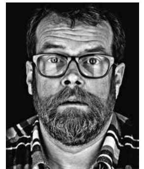
Jochen Malmshemer steht auf der Bühne für Sprachwitz und Wortgewalt.

Jochen Malmshemer, bekannt aus der Kabarettserie „Neues aus der Anstalt“ (heute: Die Anstalt), kommt mit seinem neuen Programm „Statt wesentlich die Welt bewegt, hab' ich wohl nur das Meer gepflügt – ein Rigoroseum andershausen“ nach Bedburg!