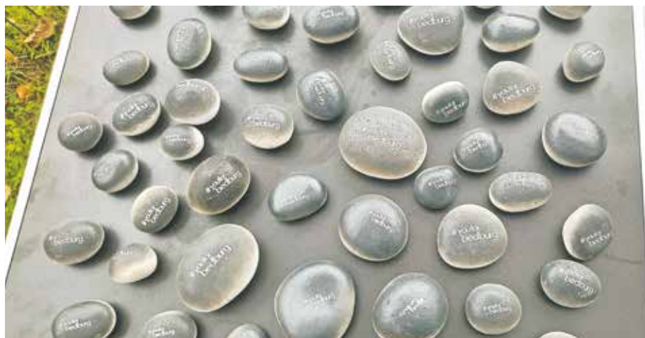
Sollten Sie einen dieser Steine finden, können Sie davon ein Foto machen, ihn mitnehmen und woanders verstecken.

Eismann, der die Kinder am Spielplatz mit leckerem Eis versorgte. Die Veranstaltung fand in Zusammenarbeit mit dem Team von Integralis e.V. statt und ist Teil des Jahresprogramms „Bedburg lebt Demokratie!“, welches mit Fördermitteln durch das Bundesprogramm „Demokratie leben!“ durchgeführt wird.