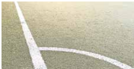
Neue Kunstrasenplätze im Stadtgebiet.

Seit 2019 wurde eine Reihe von Investitionen für die Sportvereine von Seiten der Stadt getätigt. Dazu