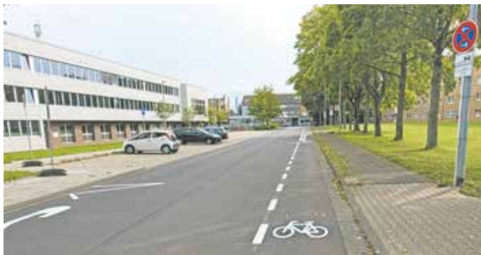
Für Fahrradfahrer gibt es auf der Gustav-Heinemann-Straße in Kaster nun einen Schutzstreifen.

Aufgrund des Radschutzstreifens entfallen auf dem genannten Abschnitt der Gustav-Heinemann-Straße die seitlichen Parkmöglichkeiten. Diese werden aber durch die bereits weggefallene Parkscheibenregelung auf den mittleren beiden Doppelparkreihen vor dem Rathaus ersetzt. Auch die seitlich an das Rathaus angrenzenden Flächen können außerhalb der Dienstzeiten von der Öffentlichkeit genutzt werden.