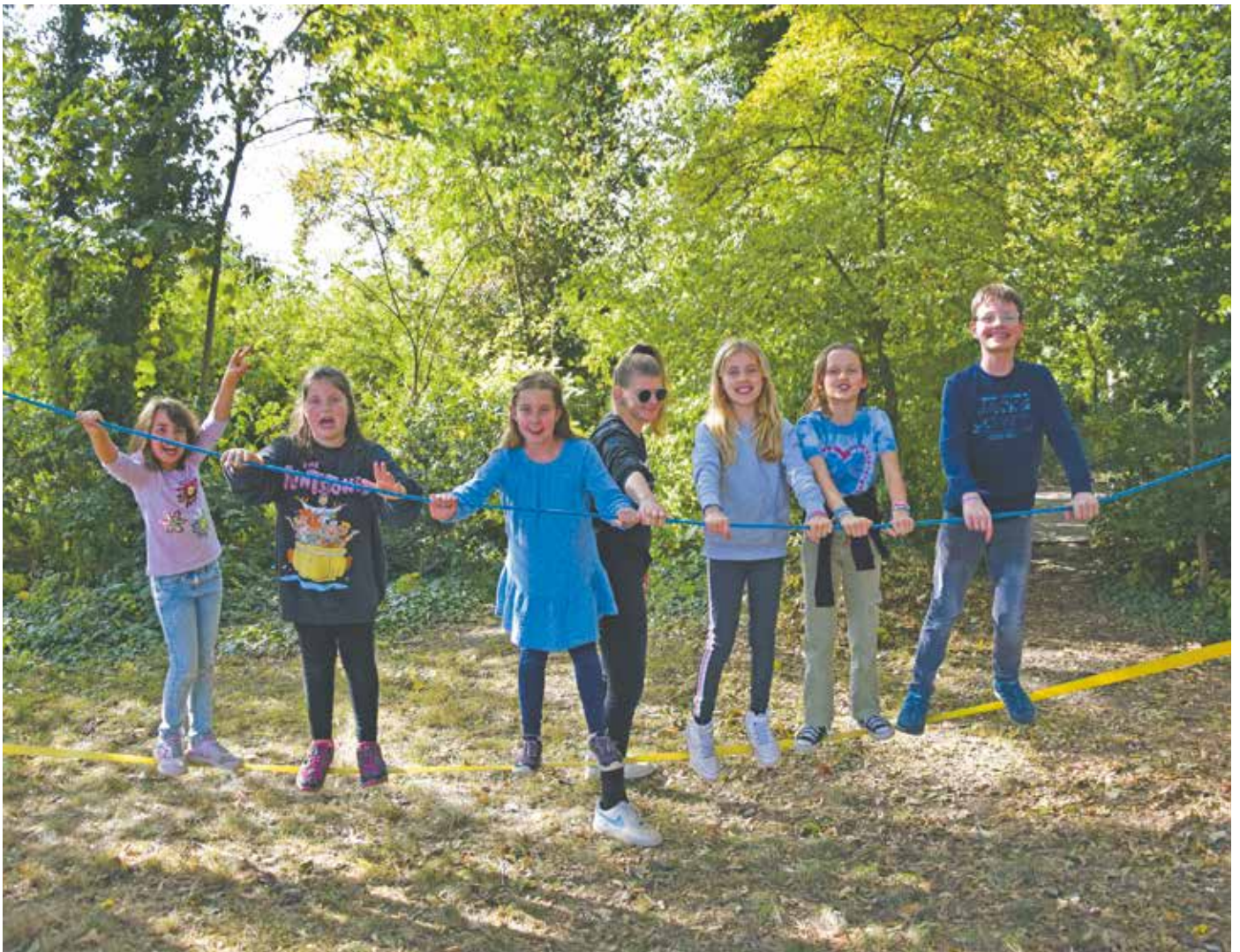
45 Kinder hatten viel Spaß bei den Herbstferienspielen der Stadt Bedburg.