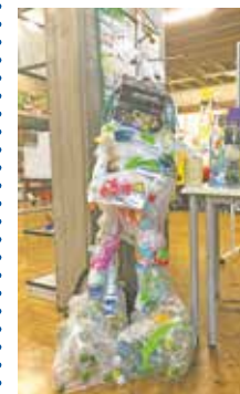
Die Schülerinnen und Schüler bastelten aus Müll eine große Figur.

Für einen tollen Abschluss sorgten die Schülerinnen und Schüler, die gemeinsam mit den Profis vom Kölner Spielzirkus eine abwechslungsreiche Show ablieferten. Dabei wurden auch die Besucherinnen und Besucher des Präsentationstages mit einbezogen. So konnten die Jugendlichen nicht nur viele neue und interessante Dinge ausprobieren, sie haben vielleicht auch neue Freunde kennengelernt.