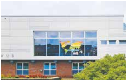
Das neue Symbol am Ratssaal ist ein Zeichen für Frieden, Vielfalt und Toleranz.