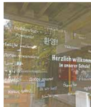
Im Eingangsbereich der Schulen werden die Kinder und Jugendlichen jetzt in verschiedenen Landessprachen begrüßt.