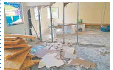
Die Räumlichkeiten des Familieninstituts wurden beim Starkregen im Juni nahezu vollständig zerstört.

Auch bei der Suche nach alternativen Betreuungsmöglichkeiten während der Sanierungsarbeiten konnte das Jugendamt der Stadt Bedburg der en-