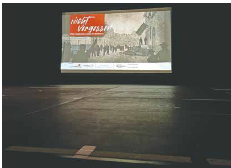
280 Menschen kamen zur Premiere des Films „Nicht Vergessen“ ins Bedburger Schloss.

die Opfer des Holocausts ebenfalls auf Schloss Bedburg statt. Nähere Informationen folgen.