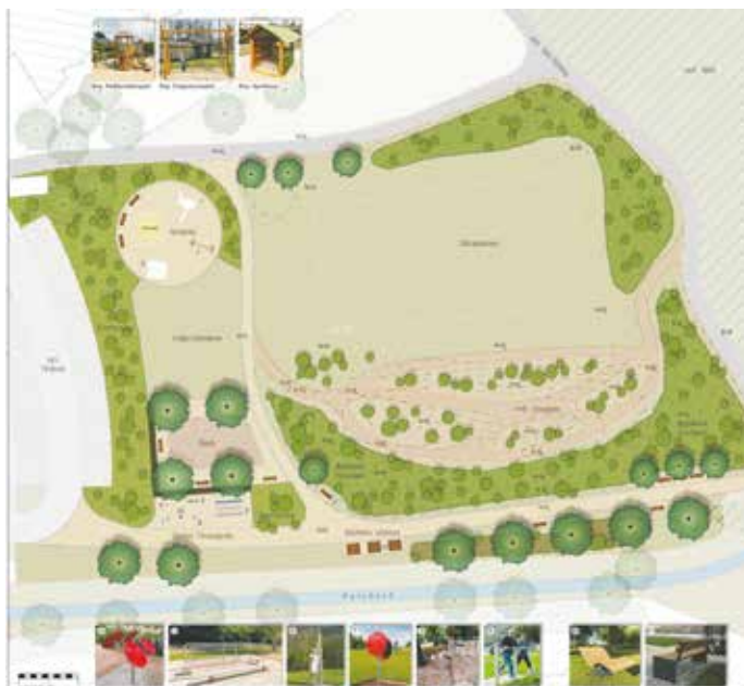
Konzeptbild zur Neugestaltung des Sportplatzes in Lipp.

Dabei kann der Plan zur Umgestaltung des Sportplatzes in Lipp eine gute Vorlage sein. Dieser Plan sieht in Lipp Aktiv-Bereiche für Kinder und Jugendliche, aber auch Ruhezone für die ältere Generation vor. In Kirdorf könnte zusätzlich das bestehende Vereinsgebäude am Sportplatz genutzt und zu einem Treffpunkt für alle Vereine, aber auch für private Feiern der Bürger umgestaltet werden.