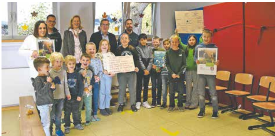
Die Kinder der Kita St. Peter und der Martinusschule haben mit ihren nachhaltigen Initiativen überzeugt.