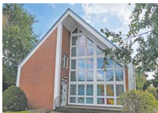
Die Neuapostolische Kirche in Lipp dient vorübergehend als Flüchtlingsunterkunft.

Vor einigen Wochen hatten wir darüber informiert, dass die Bürgerhalle in Königshoven und die ehemalige Neuapostolische Kirche in Lipp als Flüchtlingsunterkünfte vorbereitet werden. In beiden Unterkünften ziehen momentan die ersten Personen ein. Wir wünschen uns allen ein gutes Miteinander und hoffen, dass sich die Menschen hier bei uns in Bedburg sicher und wohl fühlen können!