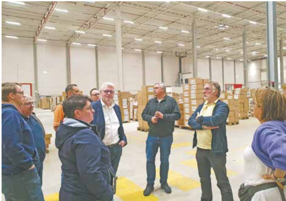
Mitglieder der SPD Bedburg lassen sich die Organisation des Logistikstandortes in den großen Hallen von P&C erläutern.

In dem Gespräch mit dem Standortleiter wurde deutlich, dass der Betrieb des Logistikstandortes gut angelaufen ist. Der Schichtbetrieb soll ausgeweitet werden. Es werden weiterhin Mitarbeiter gesucht.