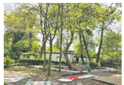
Die Minigolfanlage am Freibad sucht einen neuen Pächter.

Minigolf ist ein beliebter Freizeitsport für die ganze Familie. Für den Minigolfplatz in Bedburg (Ertstraße 15) wird nun ein neuer Pächter gesucht. Das Grundstück liegt direkt am Bedburger Freibad, besteht aus 18 Bahnen und bietet unter altem Baumbestand eine herrliche Atmosphäre, die vor, nach oder ganz unabhängig von einem Badebesuch zum Golfen und Verweilen einlädt. Parkmöglichkeiten sind in unmittelbarer Nähe vorhanden. Bei Interesse wenden Sie sich bitte an Iris Schier (i.schier@bedburg.de / 02272 402 - 202).