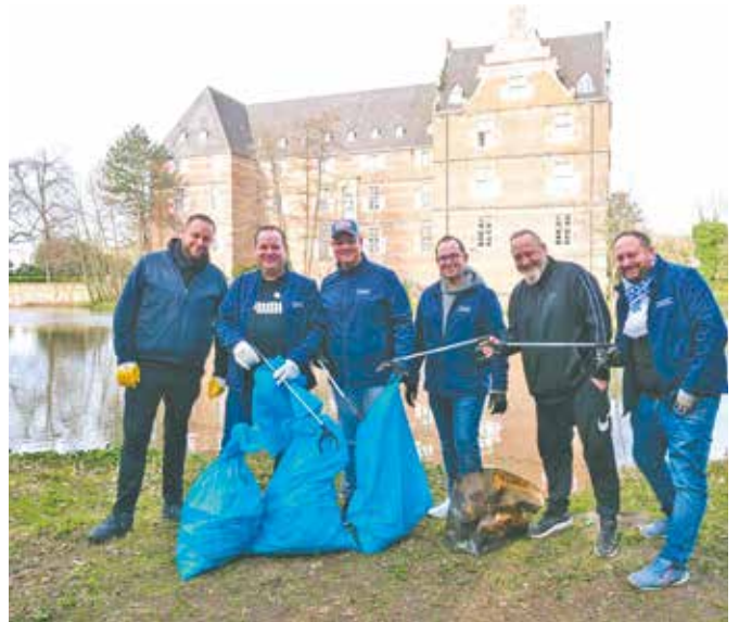
In fast allen Ortsteilen waren die vielen freiwilligen Helfer unterwegs – so auch rund um das Bedburger Schloss.

Helfer wurden auch diese Dinge aufgesammelt und anschließend vom städtischen Bauhof entsorgt.