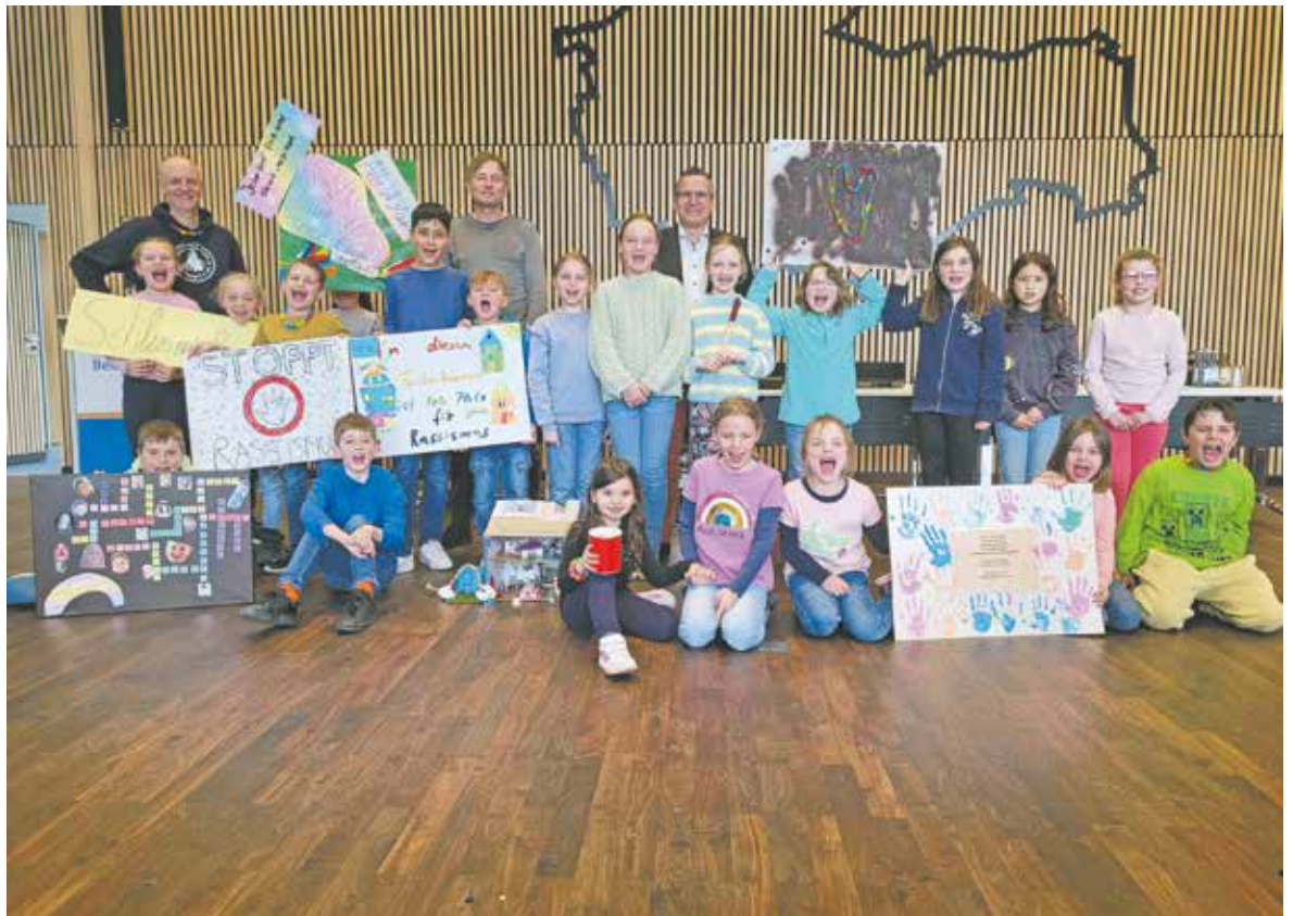
19 Kinder der Martinusschule besuchten während ihrer Projektwoche Bürgermeister Sascha Solbach im Rathaus.

Die Idee der Projektwoche zum Thema Nachhaltigkeit entstand bereits im vergangenen Jahr. Mit ihrem Konzept belegte die Martinusschule beim „Westenergie Klimaschutzpreis 2023“, den der Energiedienstleister gemeinsam mit der Verwaltung auslobte, einen tollen zweiten Platz. Ende April erfolgte jetzt die Umsetzung der Projektwoche inklusive eines großen Abschlussfestes.