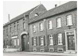
Alt-Königshovens Hauptstraße mit der Brauerei Lüpkes.

hoben geweiht, deren Vor-Vorgängerinnen bis um das Jahr 1300 nachgewiesen werden können.