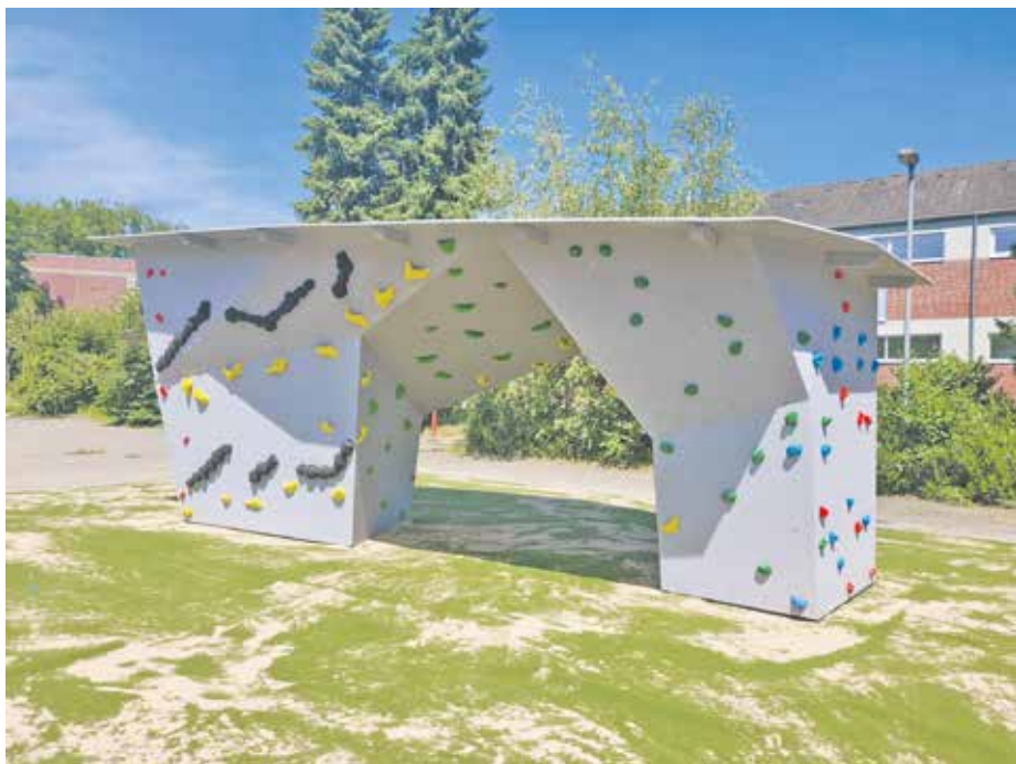
Der Boulderblock in der Mitte des Schulzentrums kann auch in den Schulsport integriert werden.

Vertreterinnen und Vertreter der Schulen, des Stadtrats und aus der Verwaltung eröffneten gemeinsam die neuen Spielgeräte, hier die Seilpyramide auf dem Schulhof des Gymnasiums.