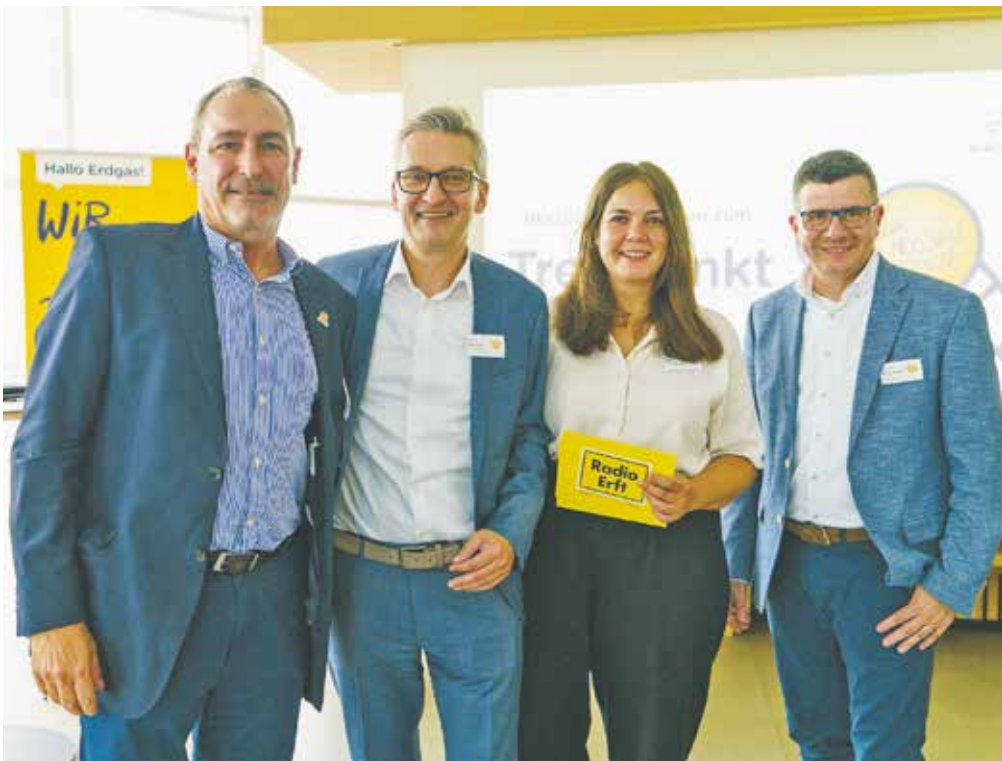
Beim Treffpunkt Energie der GVG kamen Bürgerinnen und Bürger mit Experten ins Gespräch. Am 20. November findet eine weitere Dialogveranstaltung statt.

An insgesamt fünf Themeninseln konnten die Teilnehmer in lockerer Atmosphäre konkrete