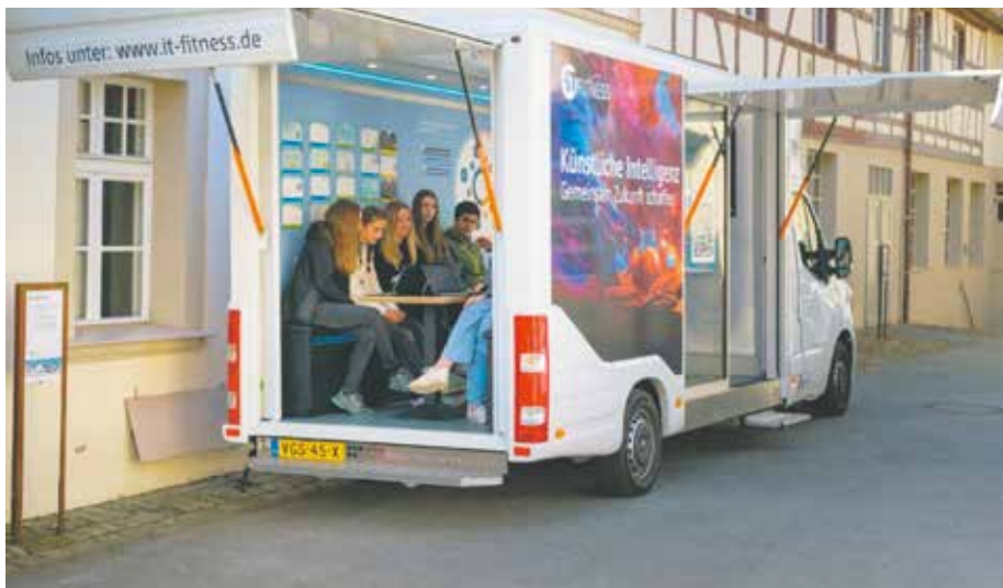
Am KI-Mobil können Besucherinnen und Besucher der MusikMeile in die Welt der Künstlichen Intelligenz eintauchen.

Erstellt eure eigenen Lyrics und Sounds mit KI