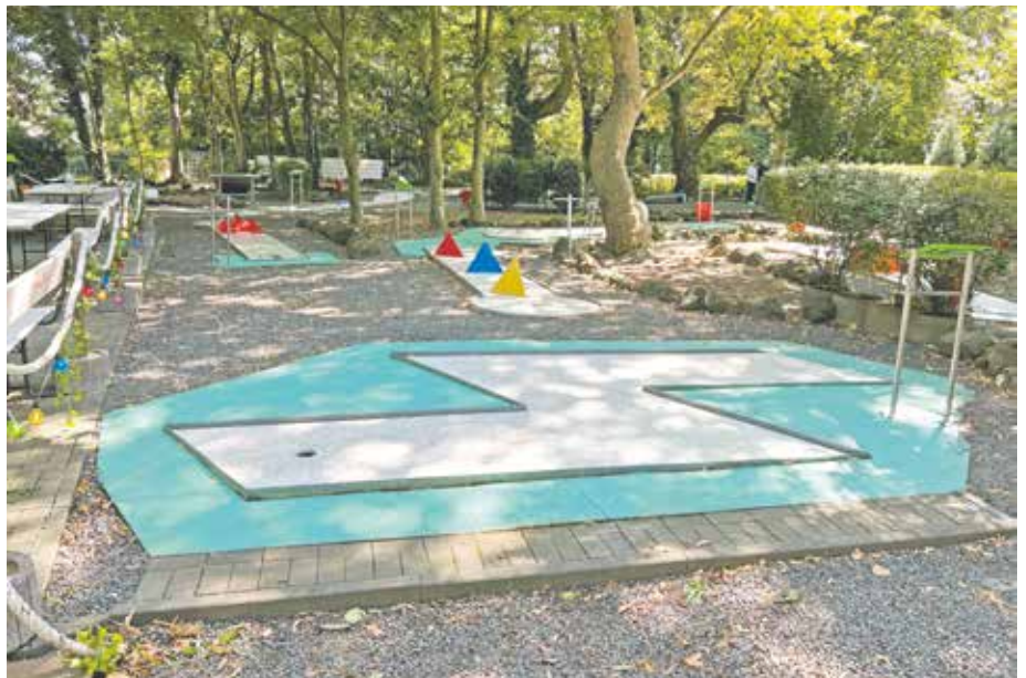
Der Minigolfplatz am Freibad hat wieder geöffnet.

Die Öffnungszeiten sind montags bis donnerstags von 12 bis 19 Uhr sowie freitags bis sonntags von 11 bis 22 Uhr.