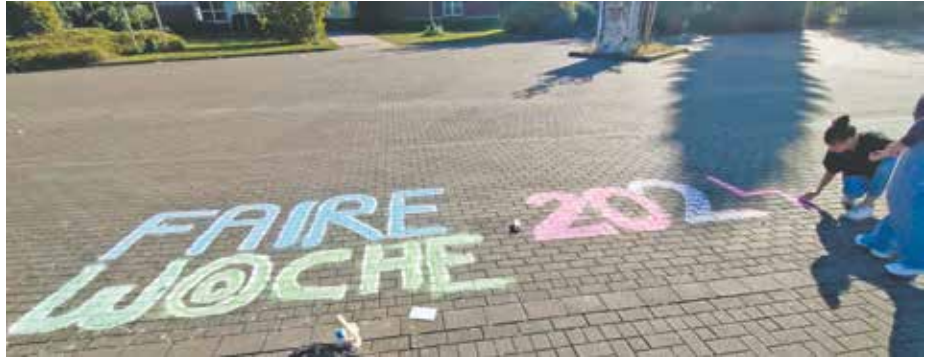
Start in den Aktionstag der Fairen Woche 2024 im Schulzentrum Bedburg.

Neben den Menschen standen ebenfalls die Tiere während des Aktionstages im Vordergrund. Die