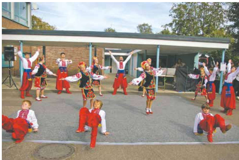
Die Tanzgruppe Blau-Gelbes Kreuz sorgte beim Fest der Kulturen für Begeisterung bei den Gästen.

Nach dem Motto: Alle machen mit beim „Drum Circle“ ermöglichte Diplom-Musik-Pädagoge Nikolas Geschwill 75 einsatzfreudigen, mutigen