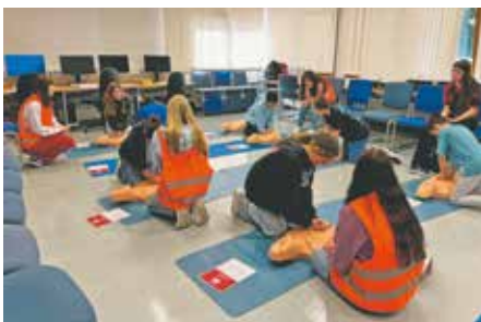
Die Fünft- und Sechstklässler der Realschule übten an einer Puppe, wie man einen Menschen reanimiert.

Anschließend konnten die Schülerinnen und Schüler an einer eigenen Puppe üben, mit welchen Maßnahmen man anderen Menschen im Notfall das Leben retten kann. „Dabei war be-