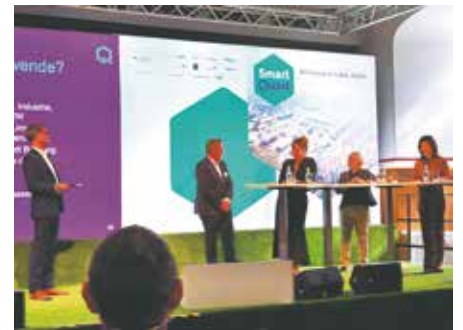
SmartQuart Halbzeitbilanz auf Schloss Bedburg.

Sprechenden Menschen kann geholfen werden. Bleiben wir also im Gespräch. Helfen Sie uns mit Ihren Rückmeldungen dabei, dass unsere Stadt lebenswert bleibt. Seien Sie mit uns Mittendrin und Vorneweg!