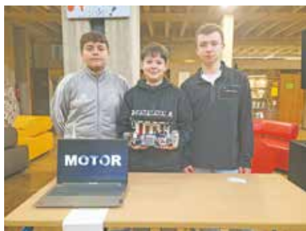
Die Realschüler entwickelten während der Your Days ihren eigenen Motor.