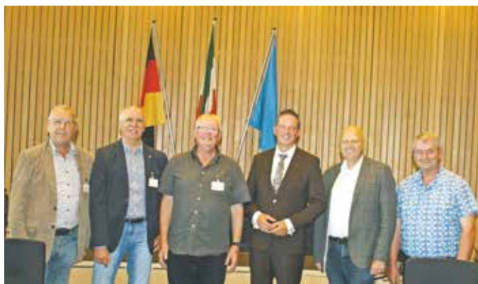
Eine Abordnung des MGV Quartettverein Königshoven besuchte im September den neuen Protektor zum Herbstkonzert 2024: Gregor Golland MdB.

Er selbst mag klassische Musik und wusste zu berichten, dass er vor einigen Jahren die Bayreuther Festspiele besucht hat und dort Wagners romantische