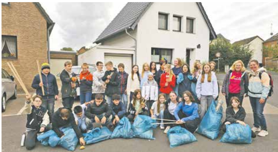
Loß für tolle Arbeit: Zahlreiche Bedburgerinnen und Bedburger bedankten sich während der Aktion bei den Saubermachern des Silverberg-Gymnasiums.

Jedes Jahr werden rund 180 Tonnen wilder Müll im Bedburger Stadtgebiet entsorgt, circa 33.000 Euro müssen im Jahr für die Entsorgung aufgewendet werden. Dabei haben Bürgerinnen und Bürger die Möglichkeit, Sondermüll einfach, ordnungsgemäß und oftmals sogar ohne gesonderte Kosten zu entsorgen. Weitere Infos dazu finden Sie auf der Homepage der Stadt Bedburg unter dem Suchbegriff „Wilder Müll“.