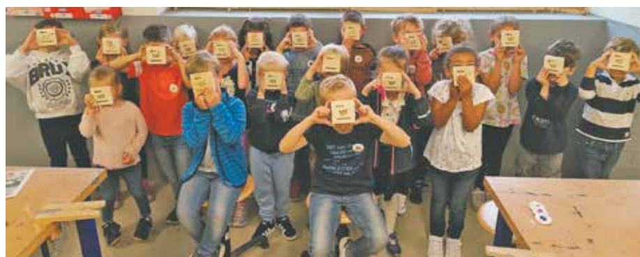
Die Schülerinnen und Schüler freuten sich besonders über ihre eigenen „Würdetäfelchen“.