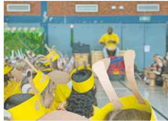
Die Projektwoche sorgte insbesondere bei den Schülerinnen und Schülern für gute Laune.

„So viele kleine Menschen, die gemeinsam trommeln, das ist etwas Wunderbares! Die Trommel-