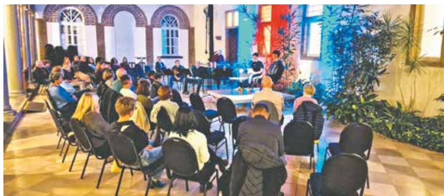
Die Schülerinnen und Schüler des Silverberg-Gymnasiums schafften es, die komplexen Themen Identitätssuche und Fremdheitserfahrungen lebendig werden zu lassen.

Die stimmungsvolle Atmosphäre im Schloss Bedburg, die berührenden musikalischen Beiträge und die grandios vorgetragenen Lesungen der Schülerinnen und Schüler machten diesen Abend zu einem unvergesslichen Erlebnis. Besonders die Art und Weise, wie die Jugendlichen die Themen Identität, Heimat und Zugehörigkeit präsentierten, zeigte, wie bedeutsam diese Fragen auch für die junge Generation sind.