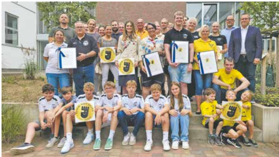
Bereits 13 Bedburger Vereine wurden mit dem Kinder- und Jugendschutzsiegel ausgezeichnet - weitere sollen folgen.

Darüber hinaus erarbeiten die Vereine in Zusammenarbeit mit der Stadt Bedburg und unter