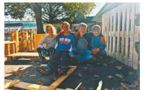
Bei den Herbstferienspielen der Stadt Bedburg werkten die Teilnehmerinnen und Teilnehmer auf ihrem eigenen Bauspielplatz.

Insgesamt besuchten in diesem Jahr über 400 Kinder die Ferienfreizeiten der Stadt Bedburg in den Oster-, Sommer- und Herbstferien. Auch im nächsten Jahr wartet auf die Kinder und Jugendlichen in Bedburg ein großes Angebot. Infos zu Events und Anmeldeöglichkeiten gibt es in der digitalen Ferien- und Freizeitbroschüre, die zu Beginn des kommenden Jahres erscheint.