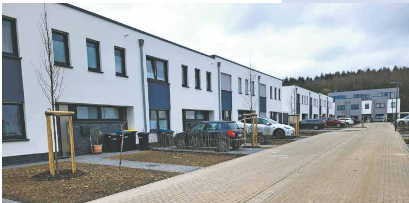
In der Ressourcenschutzsiedlung Bedburg-Kaster sollen zwei weitere Mehrfamilienhäuser entstehen.

Über eine entsprechende Anmeldemaske, die